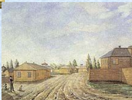
«Главная улица в Чите»