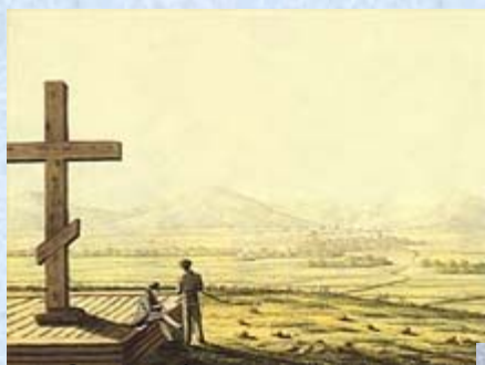
«Сопка близь Читы с могилы неизвестного солдата»