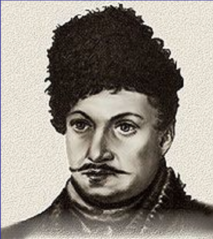
Рисунок Н.Бестужева 1839г.