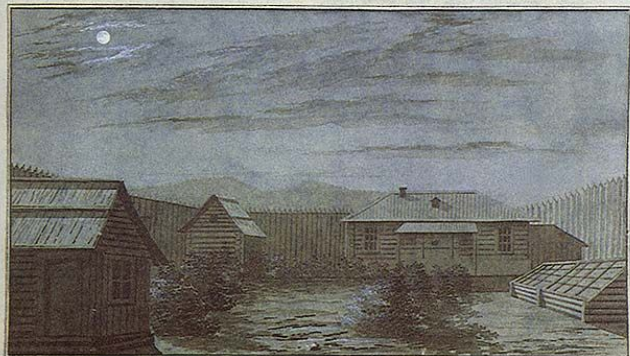
«Второй читинский острог в лунную ночь»