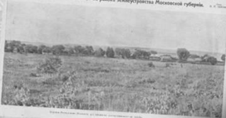
Ферма Россіи въ Сибиріи, съ трубой для перевозки и т. д.

Хутора, труба и прокатныя станицы въ районѣ землеустройства Московской губерніи.