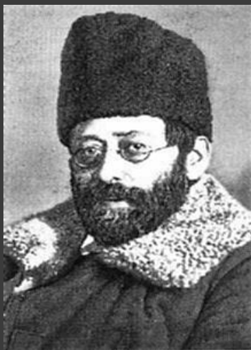
Мартов Ю. О.