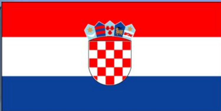
Республика Хорватия. Флаг утверждён 21 декабря 1990 года.