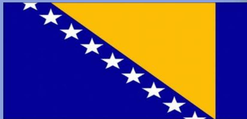
Федерация Босния и Герцеговина. Флаг утверждён 4 февраля 1998 года.