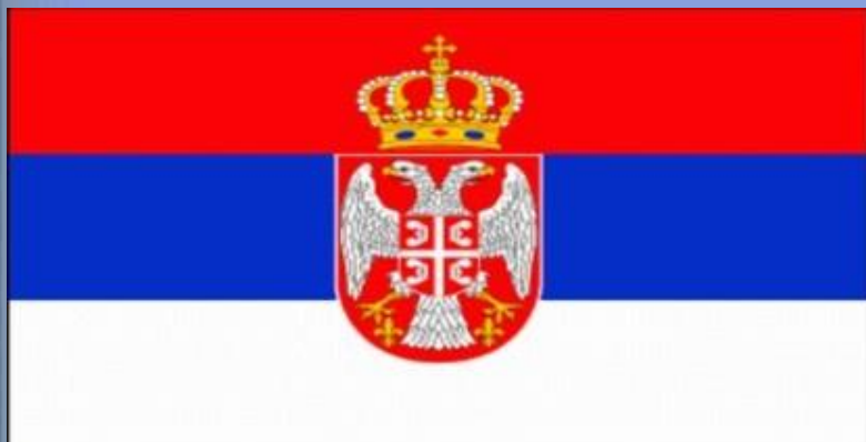
Республика Сербия. Флаг утверждён 11 ноября 2010 года.