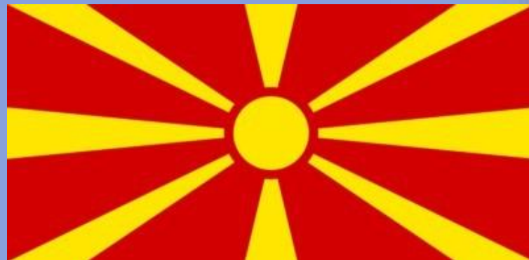
Республика Македония. Флаг утверждён 5 октября 1995 года.