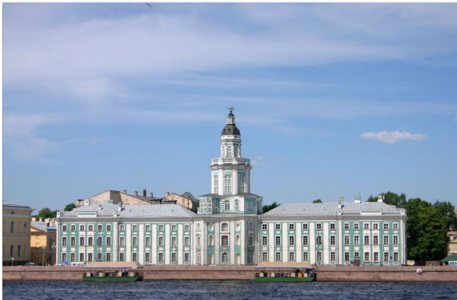
Место работы – Академия наук