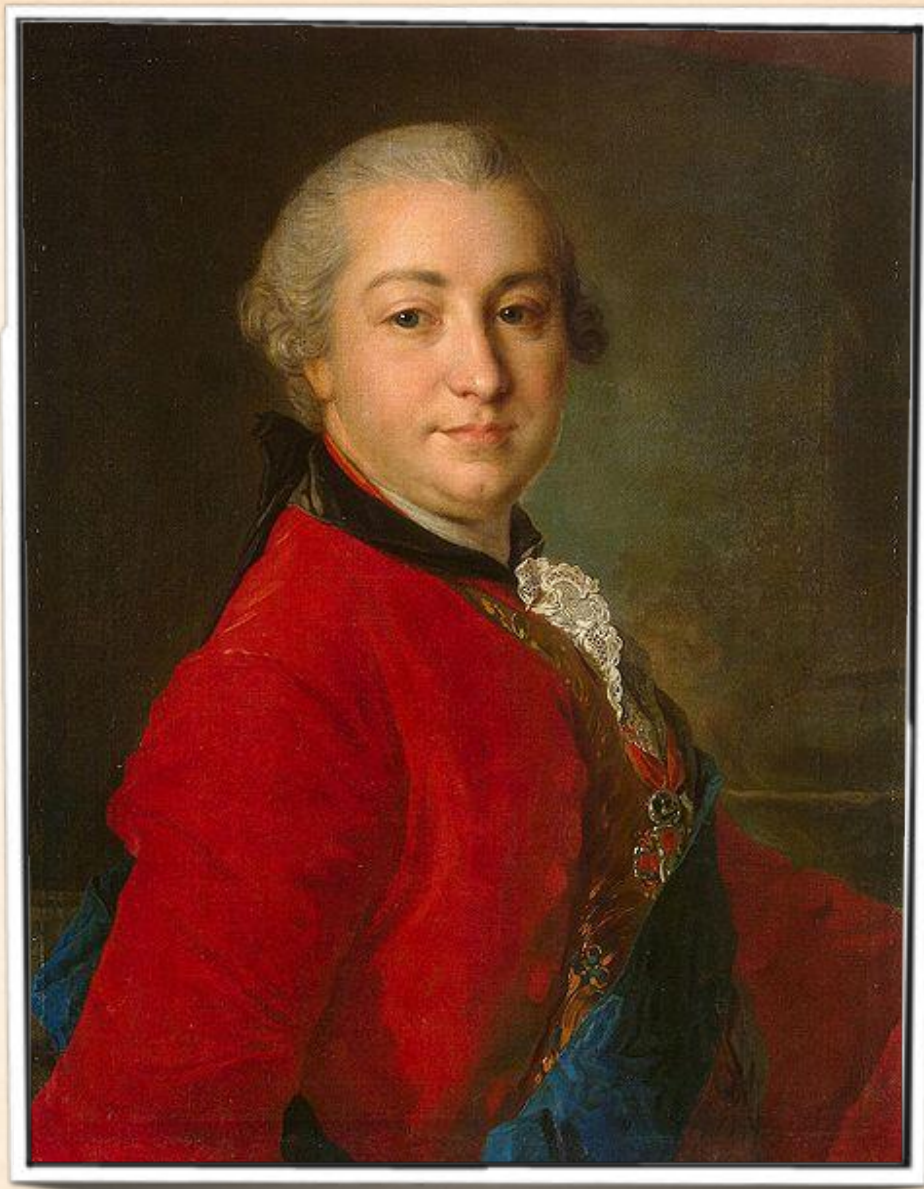
Шувалов Иван Иванович