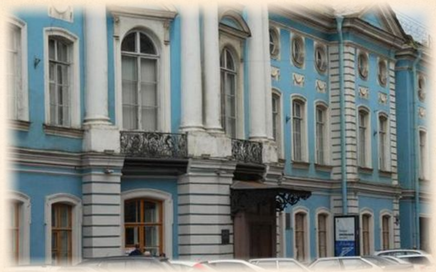
Шуваловский дворец (сохранившийся корпус на Итальянской улице). Сейчас здесь музей гигиены