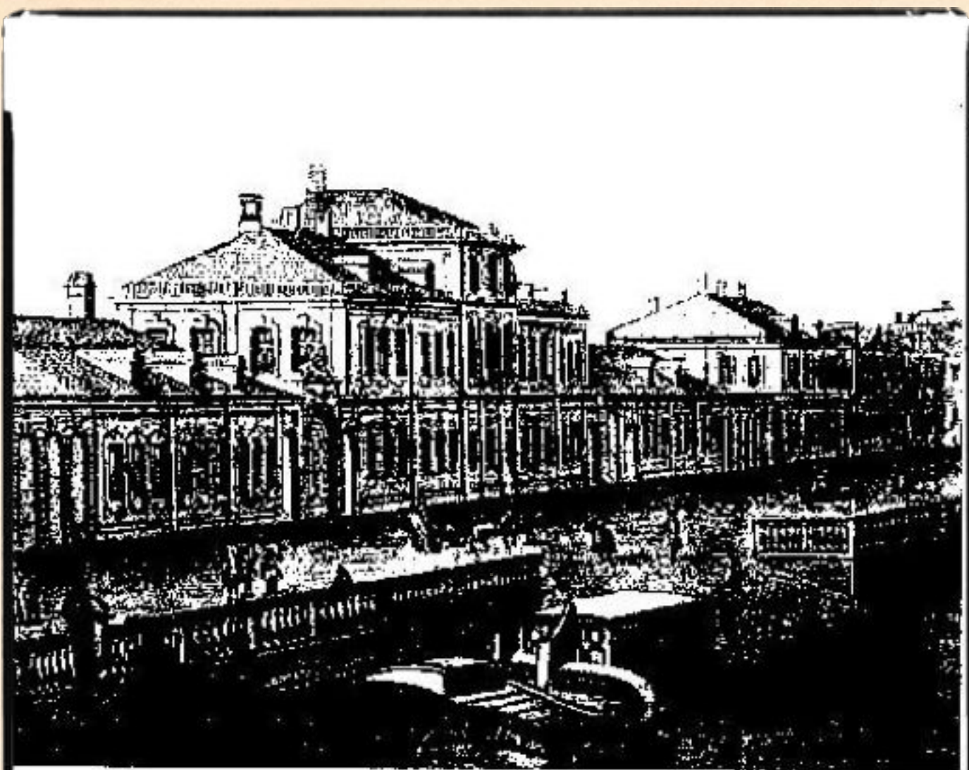
Дом Долобовцова на Зѣткѣ, куда онъ в 1757 г. перенес свои экспериментальныя работы.

Гравюра В. Н. Мухоморова, 1757 г. Деталь.