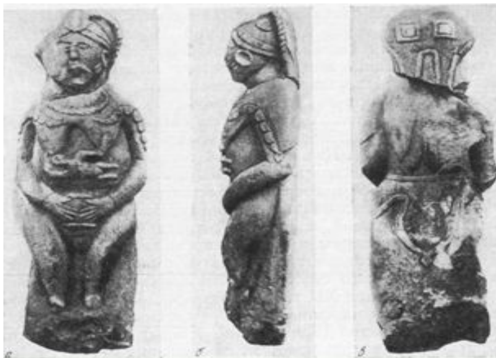
Половецкая женская статуя с ребенком. а - вид спереди; б - вид слева; в - вид сзади