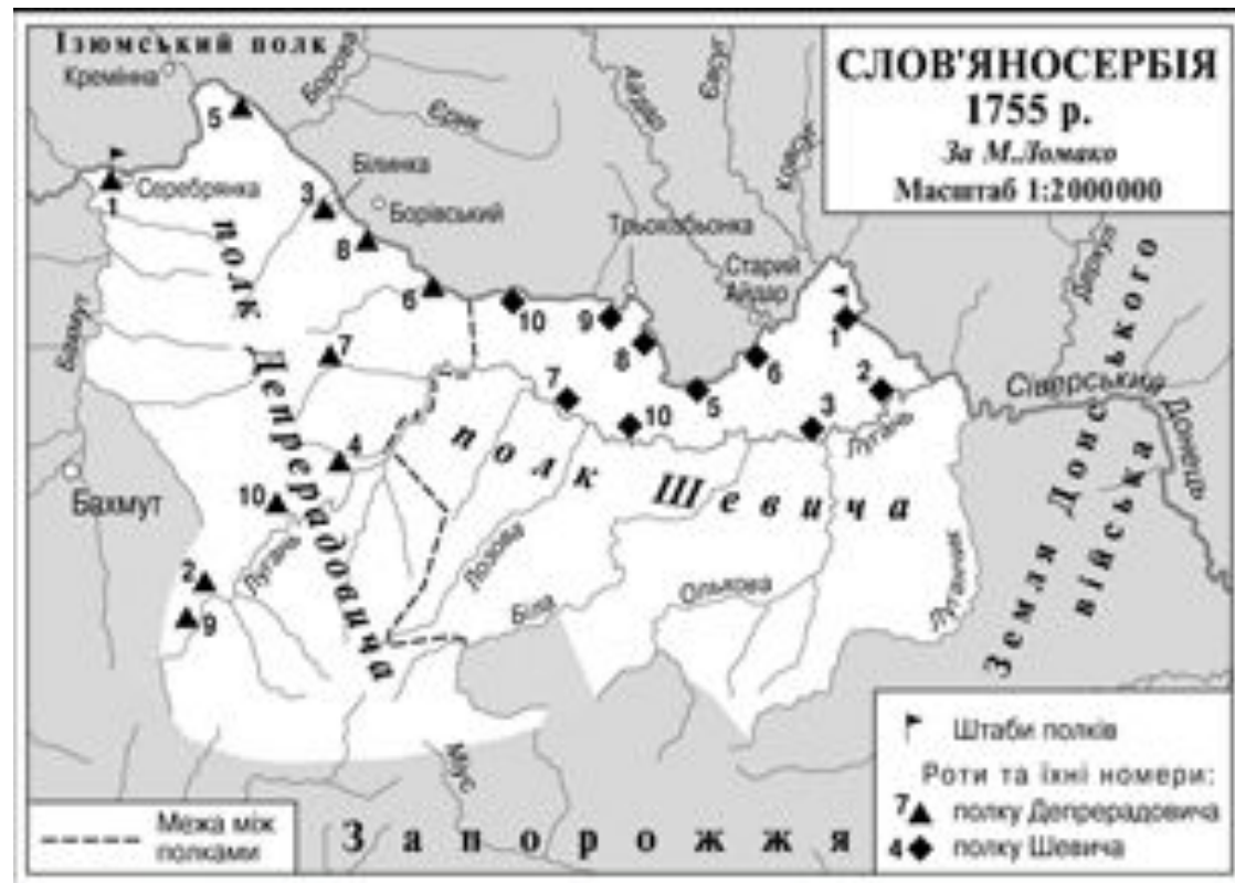
Славяносербия 1755 год