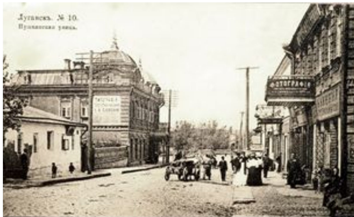
Луганск. Пушкинская улица.