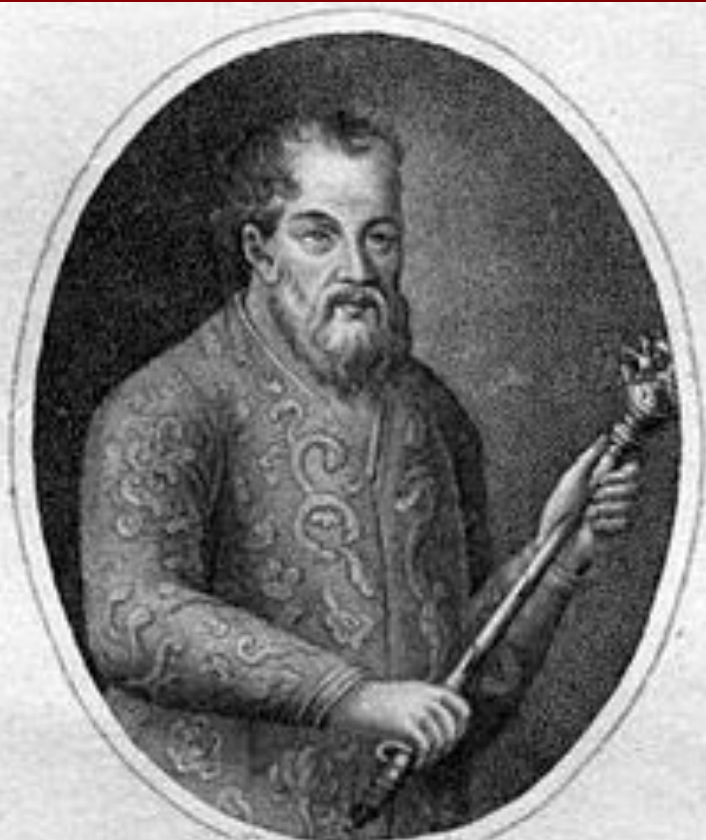
Князь, Дмитрий Михайлович Пожарский, Бояринъ.