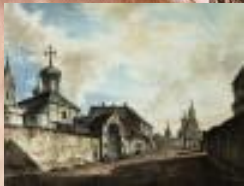
Слева Церковь Гребневской Божьей матери, рядом с которой был похоронен Л.Ф. Магницкий