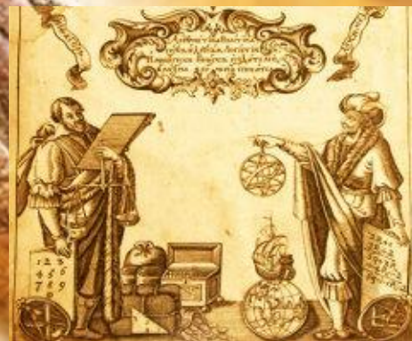
Фронтиспис из “Арифметики” Магницкого. Гравюра на меди М. Карновского