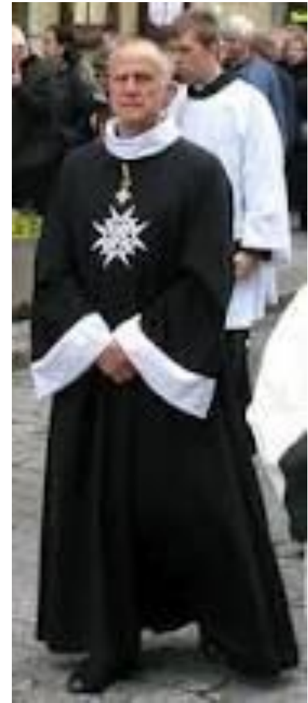
Почетный рыцарь Мальтийского Ордена: XXI век

Родившись, как военизированная религиозная структура, Мальтийский орден к нашему времени превратился в гражданскую и по преимуществу светскую организацию. Большинство рыцарей ордена не принадлежат к религиозным структурам.