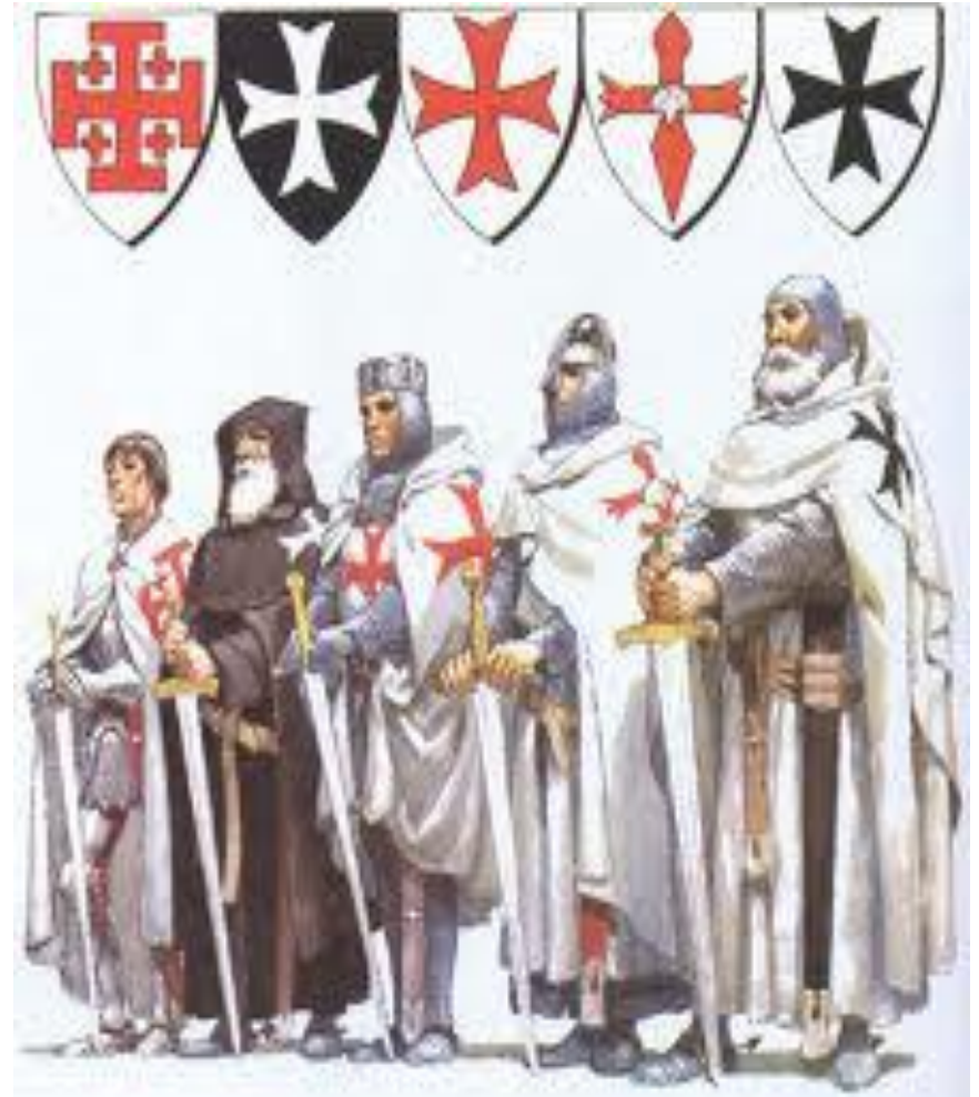
Орден Святого Иона Иерусалимского

Мальтийский орден был основан в Средние века как монашеско – рыцарский орден. Его члены видели свою миссию в том, чтобы лечить и защищать паломников в Святую землю. Поскольку рыцарям приходилось часто сражаться, чтобы отстоять свои владения, Орден приобрел довольно воинственные черты.