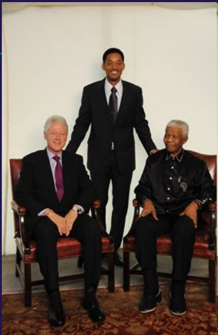
С Биллом Клинтонем и Уиллом Смитом