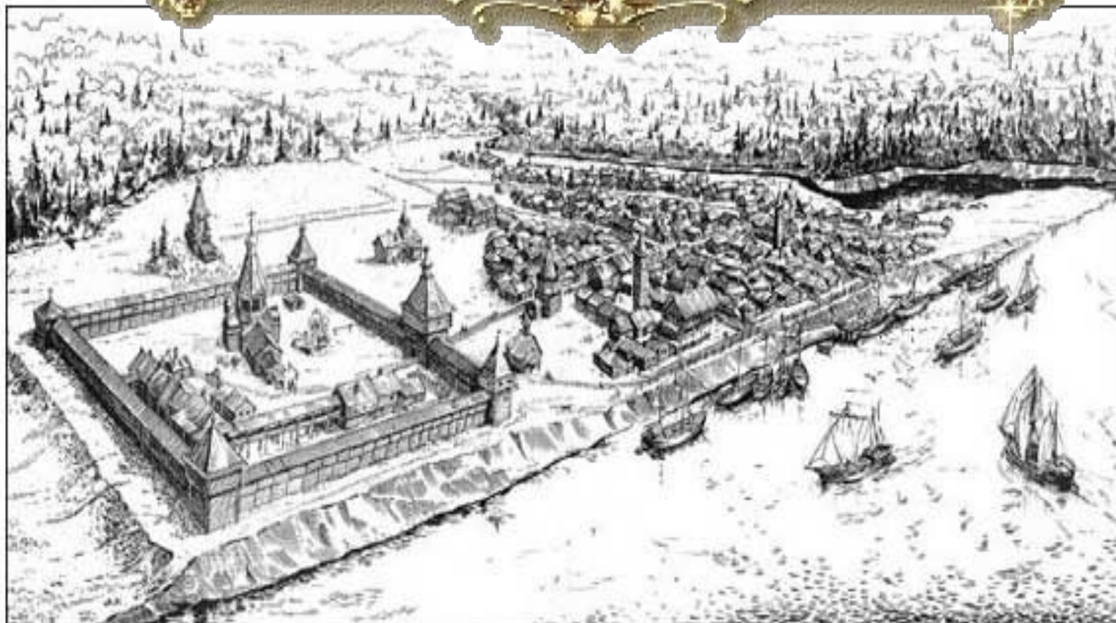
Град Мангазея. Реконструкция.