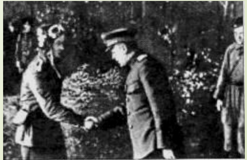
А.Новиков поздравляет Маресьева с присвоением звания Героя Советского Союза