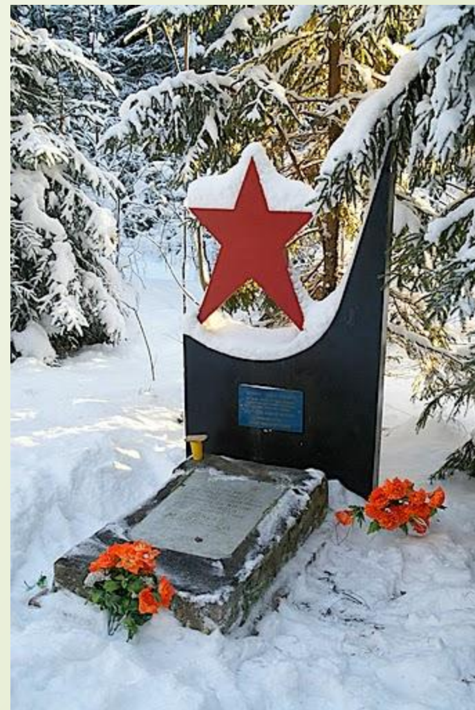
Памятник на том месте, где нашли лётчика