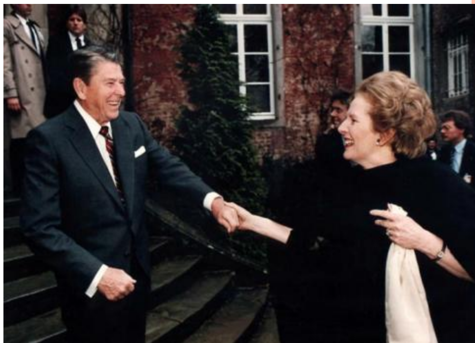
МАРГАРЕТ ТЭТЧЕР И РОНАЛЬД РЕЙГАН