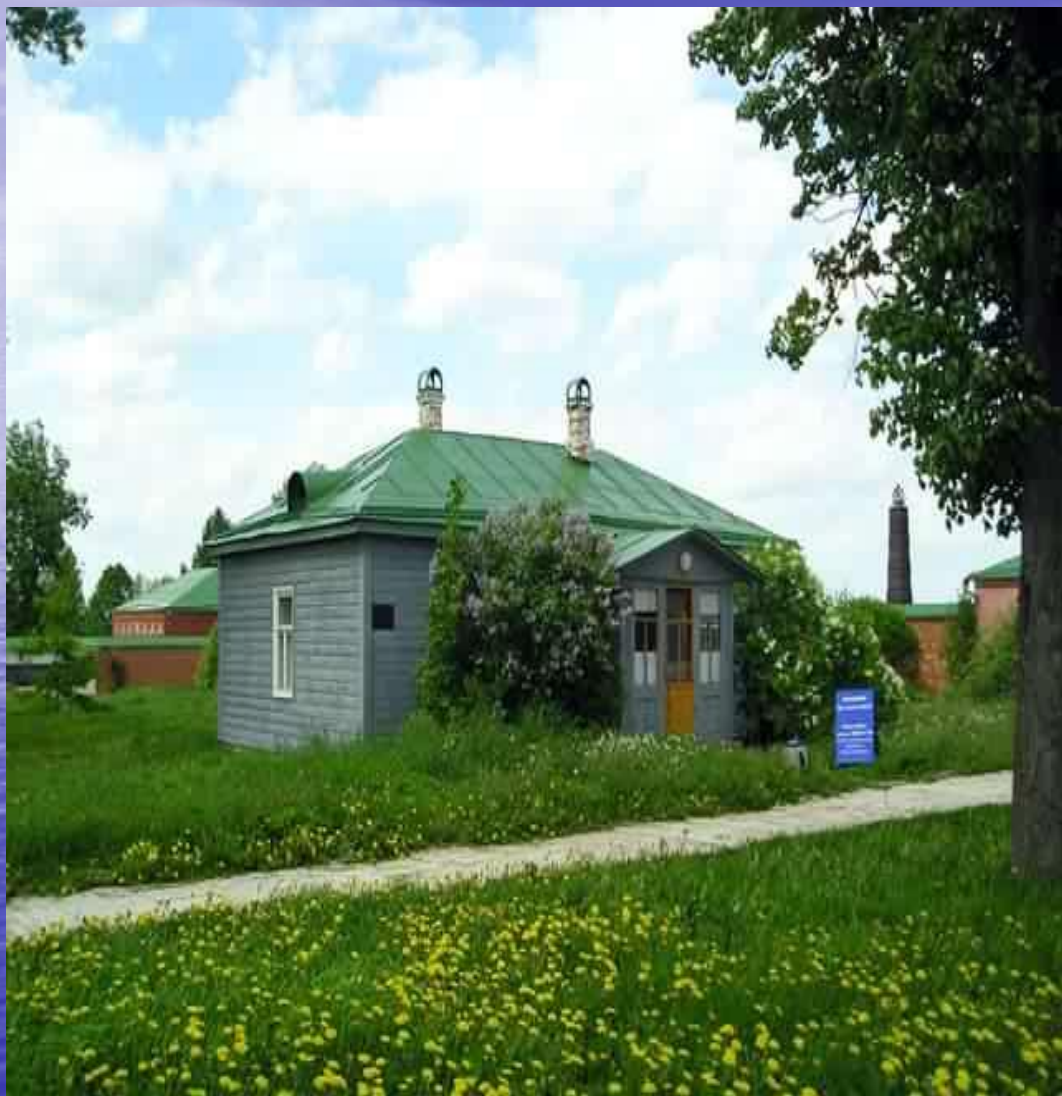
Сторожка Маргариты на Бородинском поле