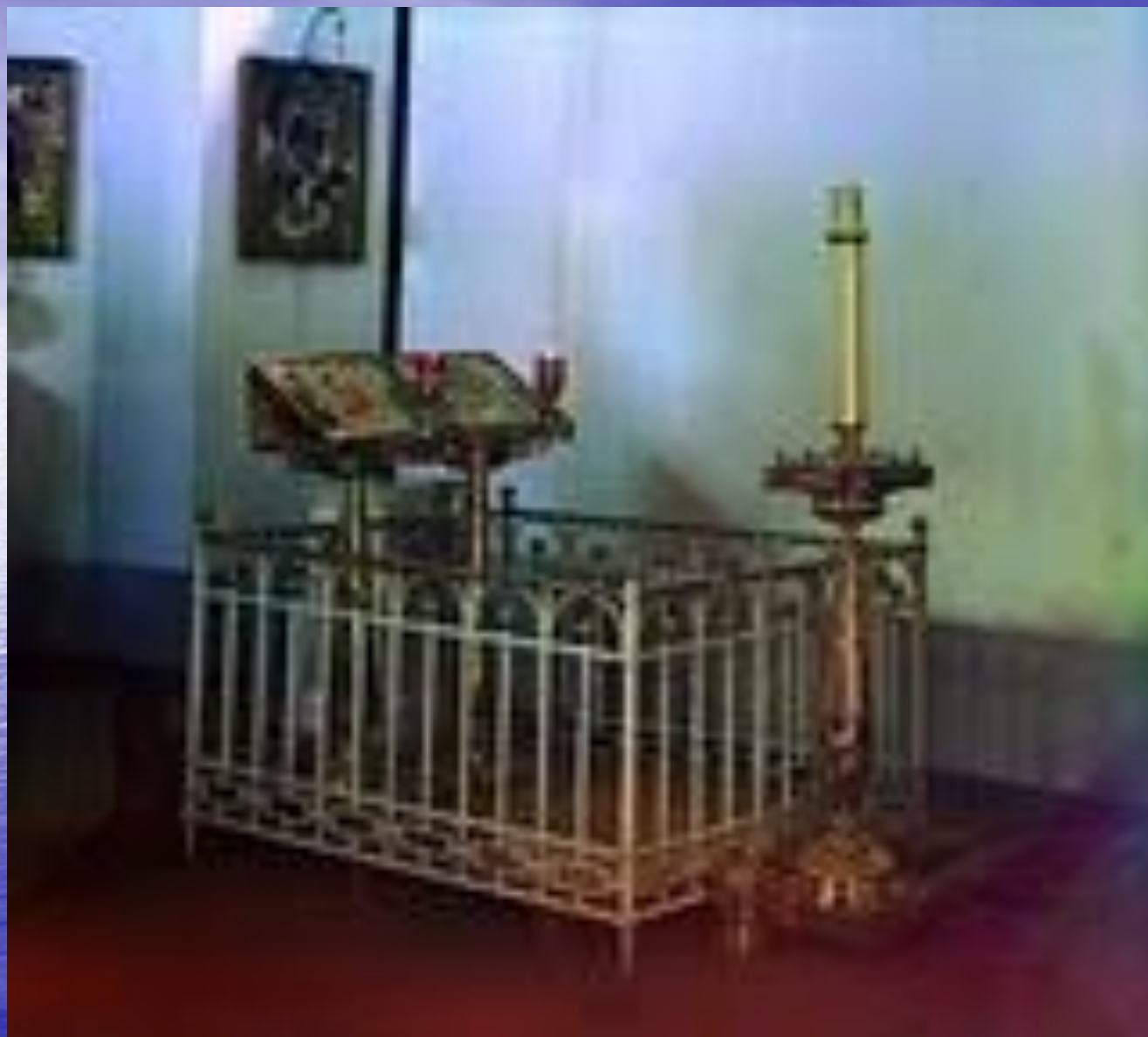
Могила Маргариты Тучковой