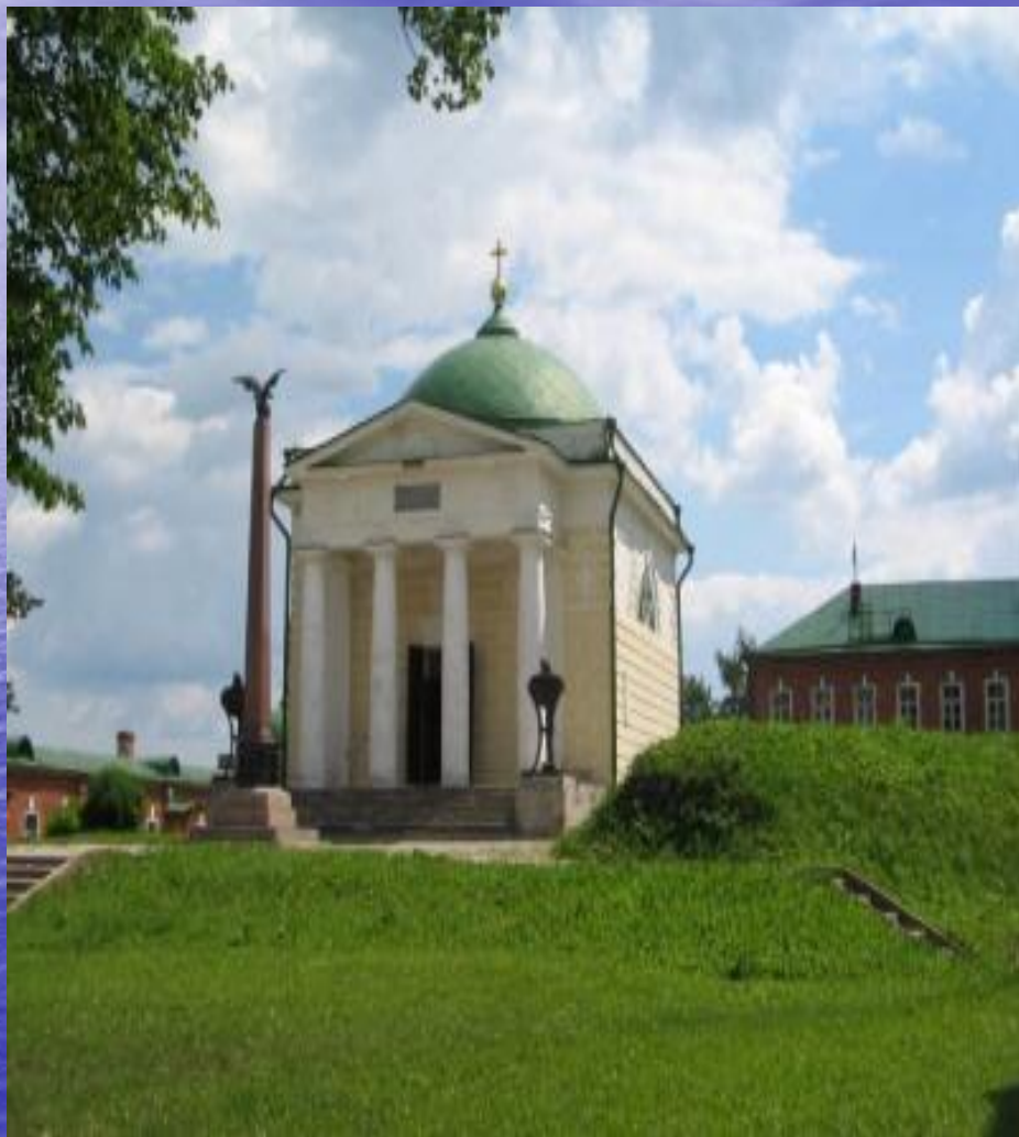
Спасо- Бородинский храм