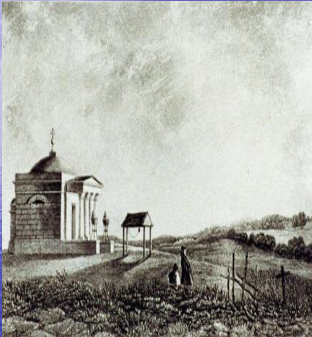
Спасо- Бородинский храм в 1818 году