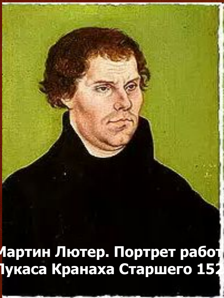
Мартин Лютер. Портрет работы Лукаса Кранаха Старшего 1526