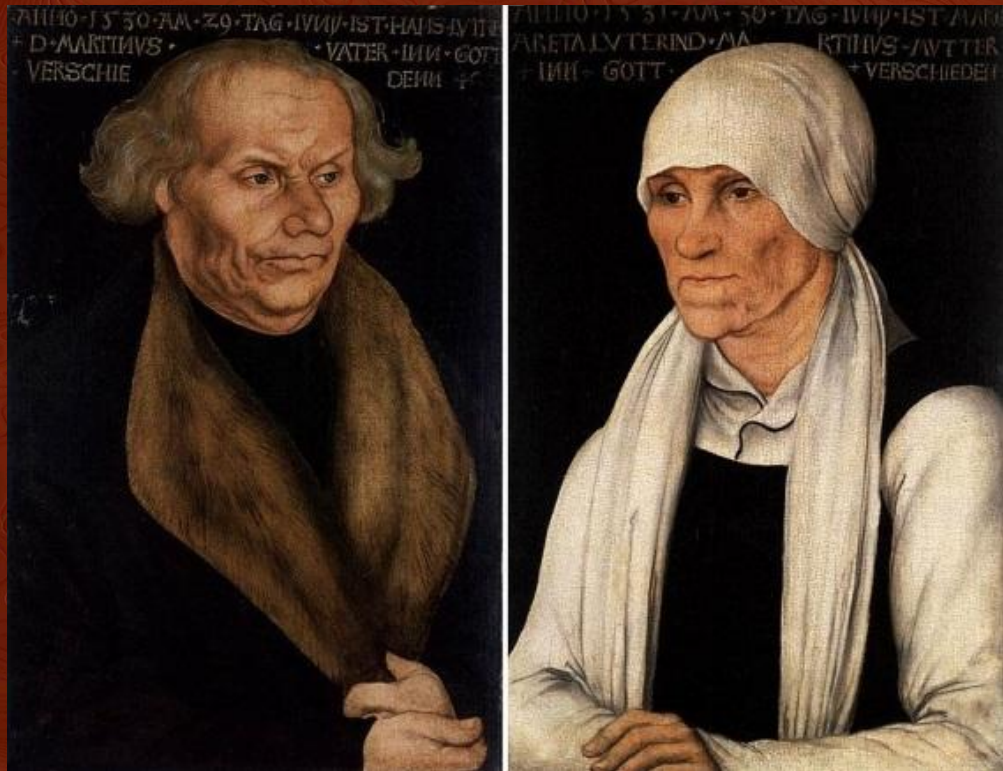
Лукас Кранах. Ганс и Маргарита Лютер

Мартин Лютер родился в семье Ганса Лютера (1459—1530) — бывшего крестьянина, перебравшегося в Эйслебен (Саксония) .. После рождения Мартина семья переехала в горный городок Мансфельд, где отец стал зажиточным бюргером