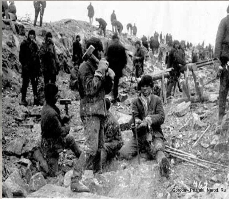
Goroda - Prizraki. Narod. Ru

С НОЯБРЯ 1934 Г. ПРИ НАРКОМЕ ВНУТРЕННИХ ДЕЛ БЫЛО ОБРАЗОВАННО ОСОБОЕ СОВЕЩАНИЕ. ОНО НАДЕЛЯЛОСЬ ПРАВОМ В АДМИНИСТРАТИВНОМ ПОРЯДКЕ, В ОТСУТСТВИИ ОБВИНЯЕМОГО, БЕЗ УЧАСТИЯ СВИДЕТЕЛЕЙ, ПРОКУРОРА И АДВОКАТА ОТПРАВЛЯТЬ «ВРАГОВ НАРОДА» В ССЫЛКУ ИЛИ В ИСПРАВИТЕЛЬНО-ТРУДОВЫЕ ЛАГЕРЯ НА СРОК ДО ПЯТИ ЛЕТ.