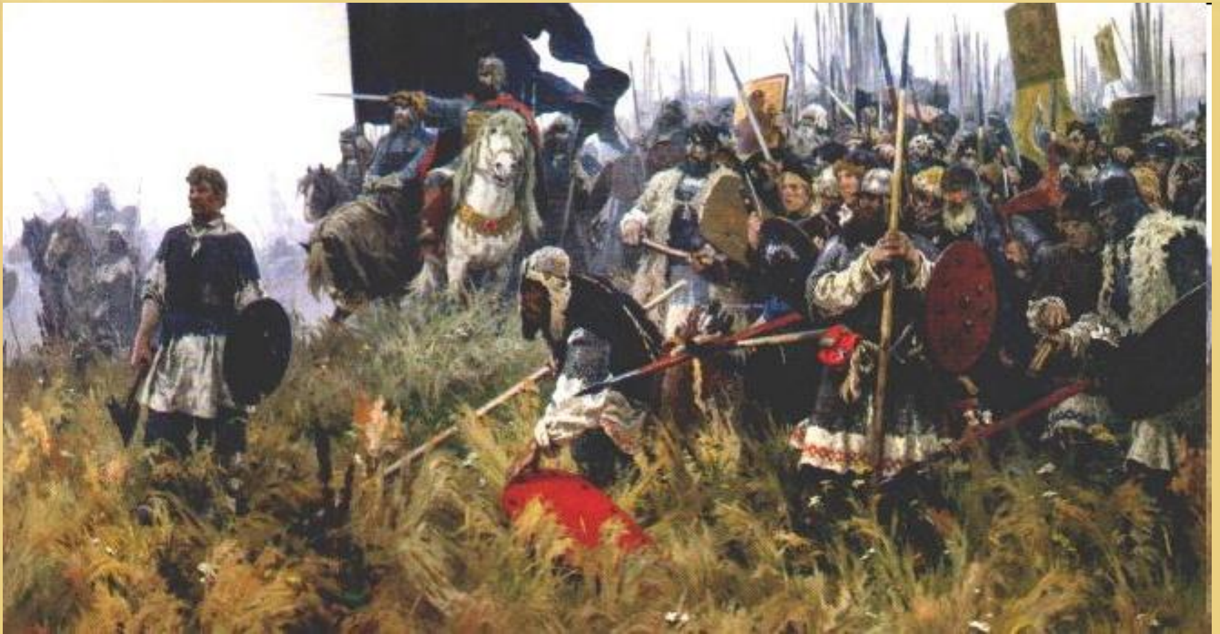
Александр Павлович Бубнов "Утро на Куликовом поле"