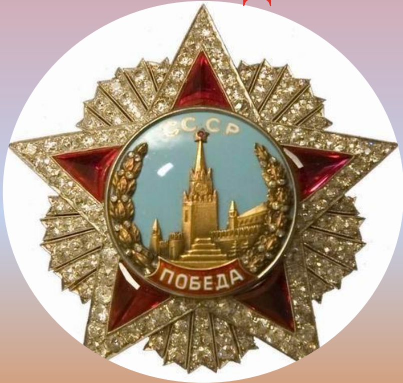
Георгий Константинович Жуков Кавалер двух орденов Победы

Орденом «Победа», как высшим военным орденом, награждаются лица высшего командного состава Красной Армии за успешное проведение таких боевых операций в масштабе нескольких или одного фронта, в результате которых в корне меняется обстановка в пользу Красной Армии.