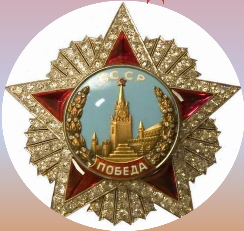
Георгий Константинович Жуков Кавалер двух орденов Победы

Орденом «Победа», как высшим военным орденом, награждаются лица высшего командного состава Красной Армии за успешное проведение таких боевых операций в масштабе нескольких или одного фронта, в результате которых в корне меняется обстановка в пользу Красной Армии.