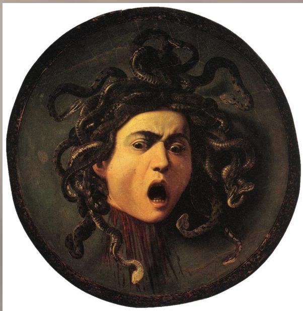
«Медуза», М. Караваджо, Изображение отрезанной головы Горгоны.

Младшая дочь Форка и Кето, единственная смертная из горгон.