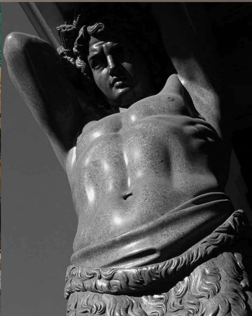
Атланты у Эрмитажа г.Санкт-Петербург.