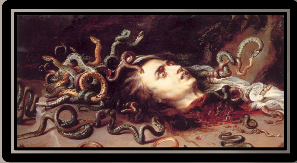
«Голова Медузы», П.П. Рубенс (1618 г.)

И в отрубленном состоянии взгляд головы горгоны сохранял способность превращать людей в камень.