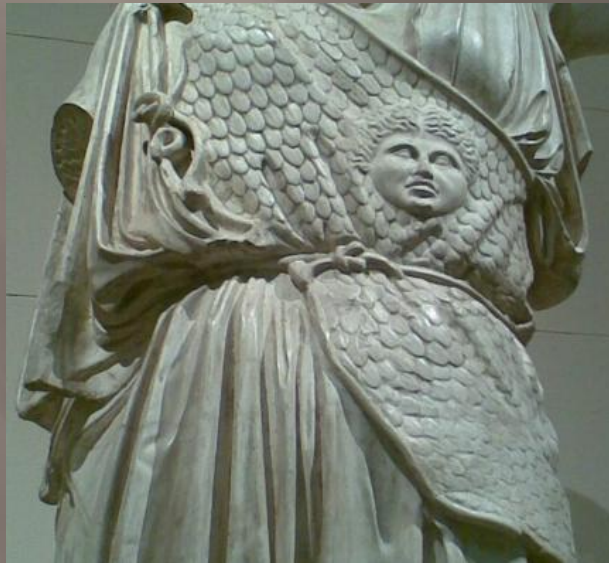
Эгида с головой Медузы на статуе «Афина Лемния»

Затем голова Медузы была помещена на эгиду Афины («на грудь Афины») — в искусстве эту голову было принято изображать на доспехах на плече богини или под ключицами на её груди.