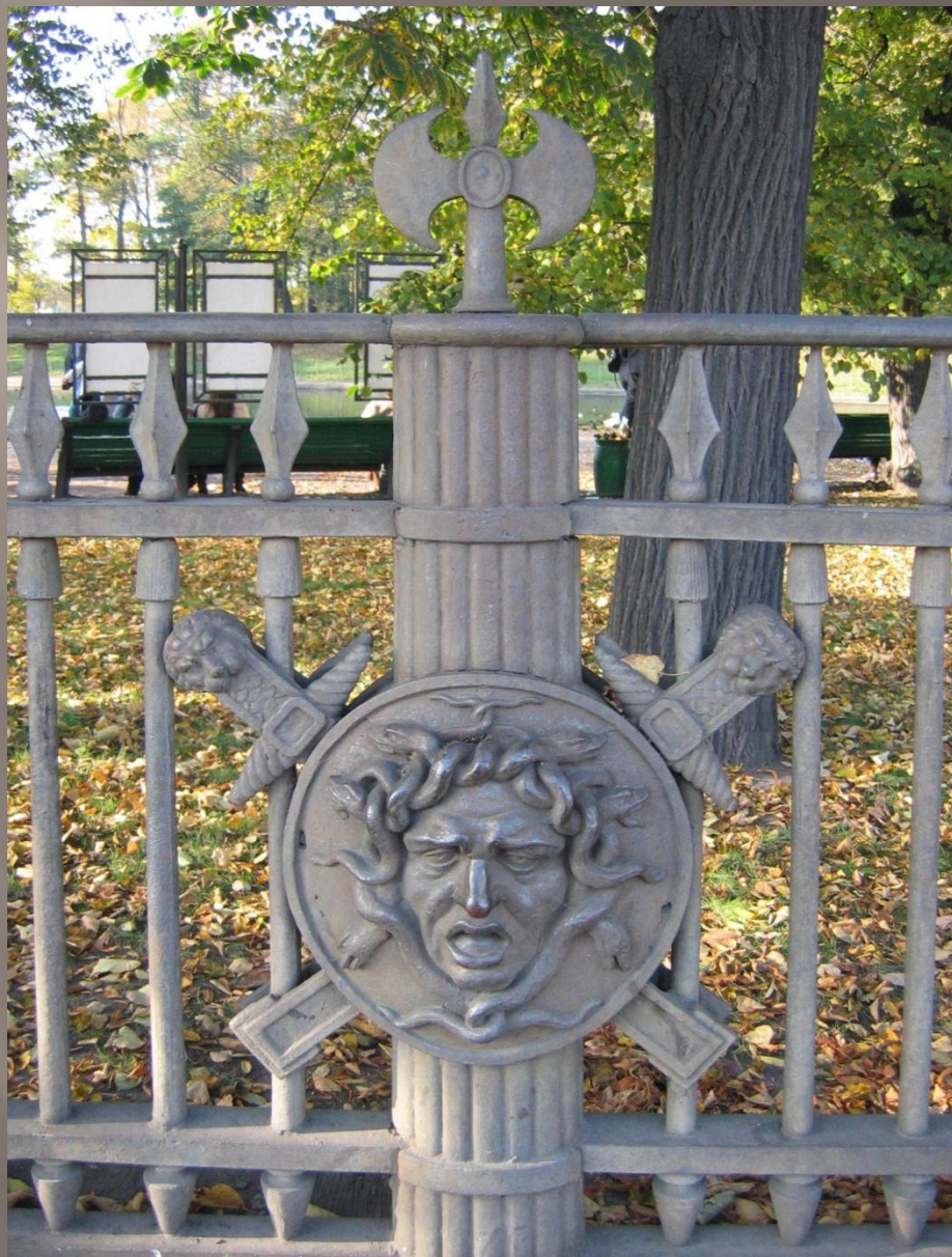
Ограда Летнего сада. г. Санкт-Петербург