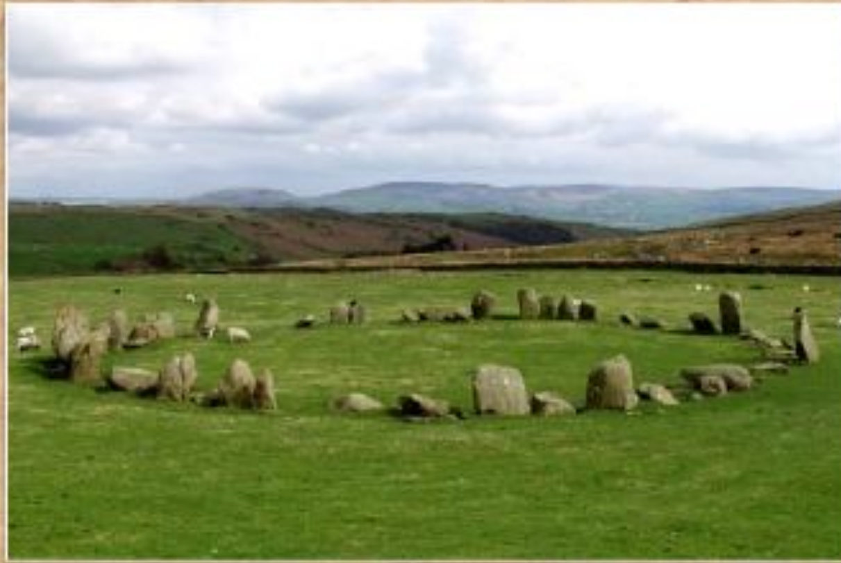
Кромлех Свинсайд (Англия)

Кромлех (от брет. crom - круг, lech - камень) - комплекс из камней, часто установленных в форме круга.