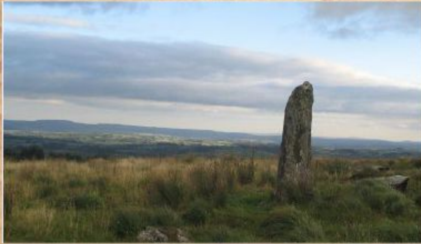
Большой менгир (графство Корк, Ирландия)

Менгир (от брет. men - камень и hir - длинный) - вертикально установленный камень высотой от 1 до 4 метров.