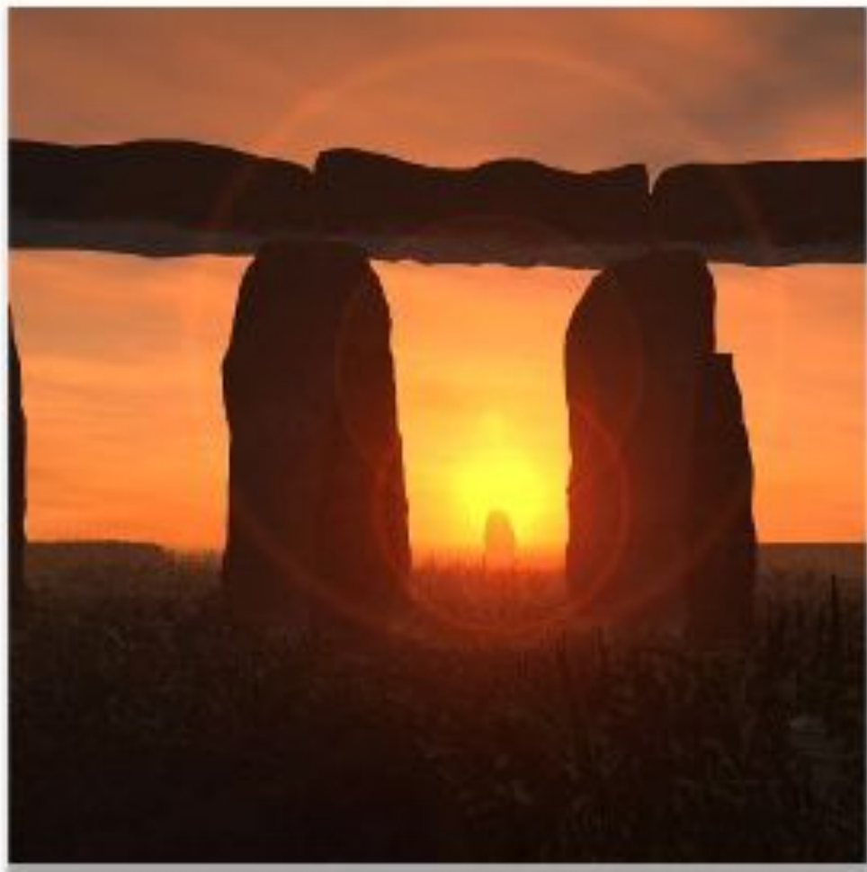
Восход солнца в Стоунхендже в день летнего солнцестояния (Корнуэлл, Англия)