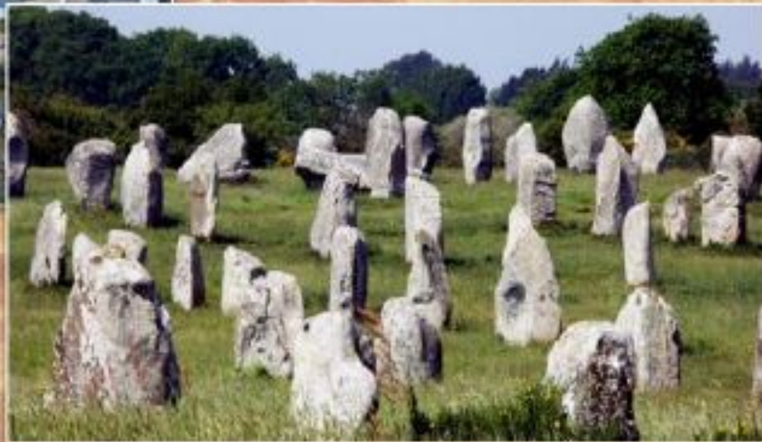
Мегалитический комплекс в виде аллей из камней (Карнак, Франция)