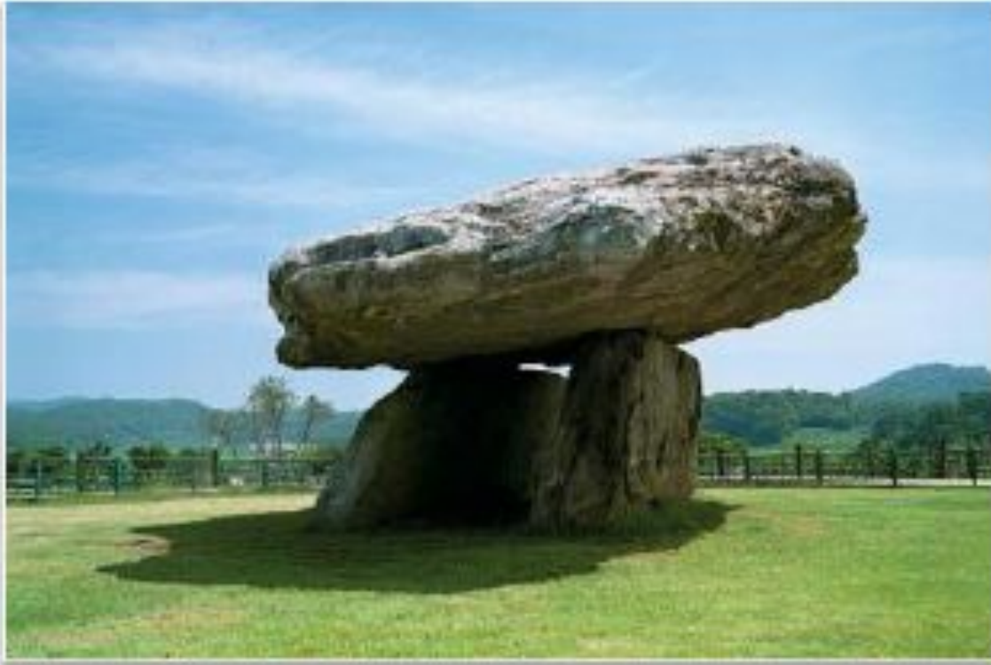
Мегалит (Южная Корея)

(от греч. μέγας — большой, λίθος — камень).