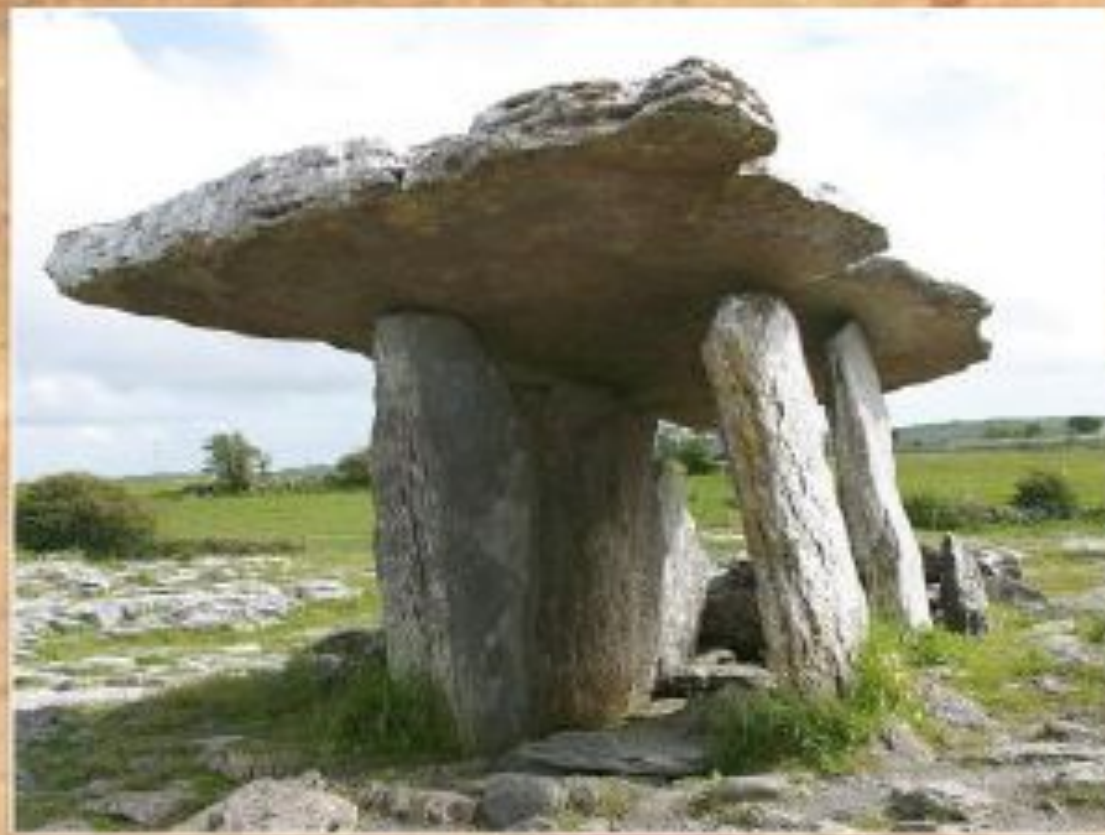
Дольмен Пулнаброн (графство Клэр, Ирландия)

Дольмен (от брет. taol taep - каменный стол) - несколько вертикально поставленных камней составляют стены сооружения, сверху они перекрыты каменной плитой.