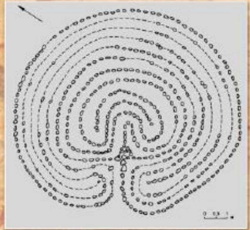
Лабиринт(Соловецкие острова, Россия)

Лабиринт - тип каменного сооружения в виде лабиринта, выложенного на поверхности земли крупными либо мелкими камнями.