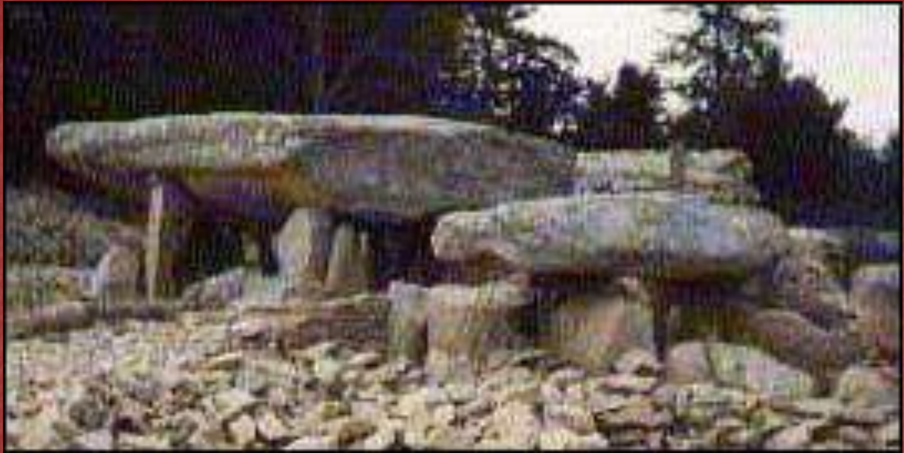
Дольмен с галереей в Локмариекере