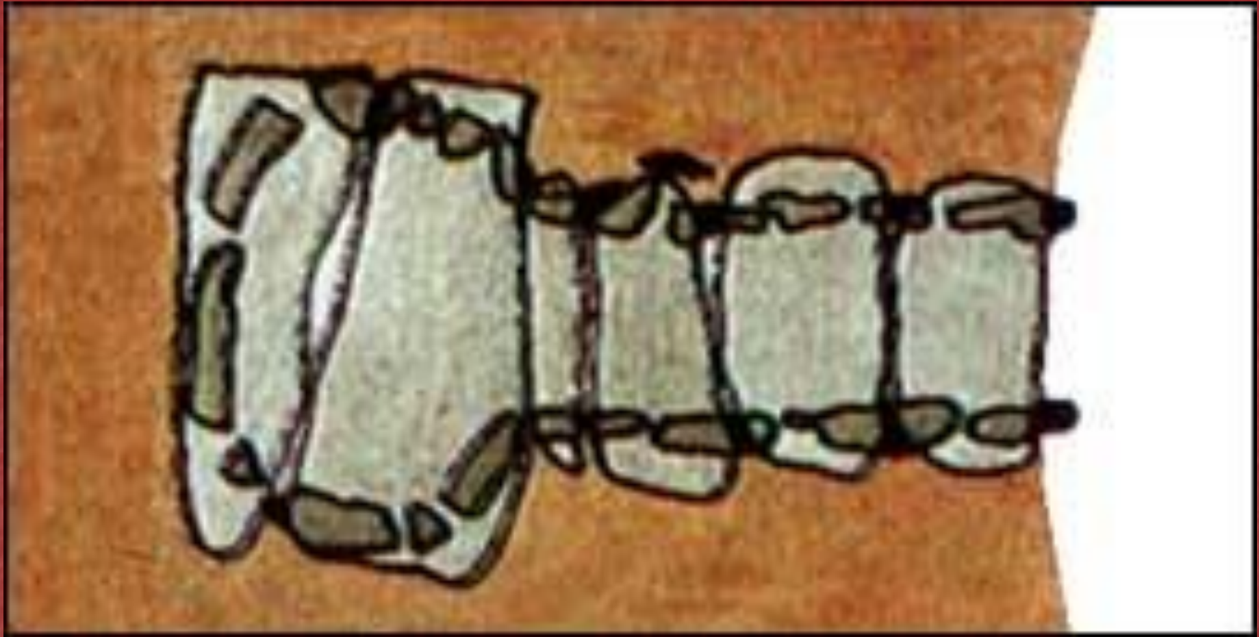
Дольмен с галереей, вид сверху