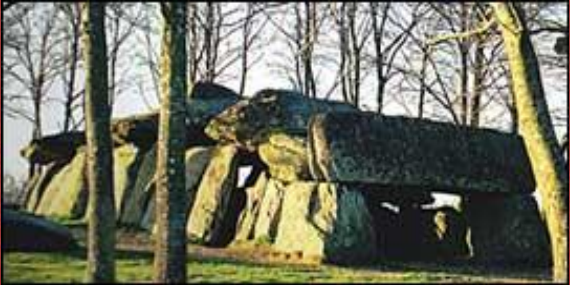
Крытая аллея в Roche Aux Fees