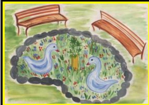
пруд-клумба со скамьей для отдыха