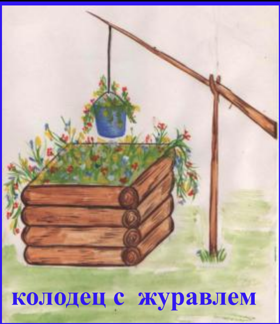
колодец с журавлем