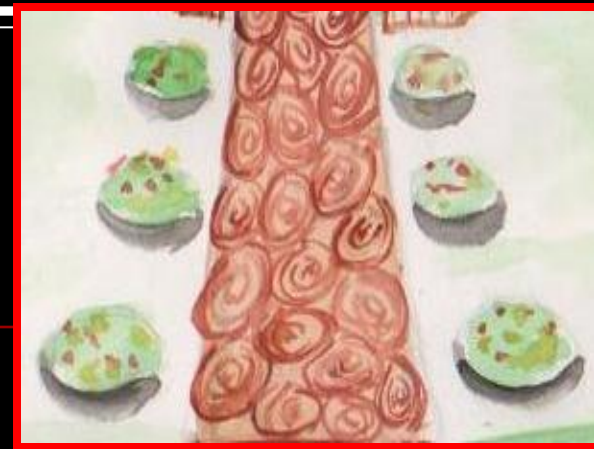
цветник вдоль дорожки, ведущей к мемориалу