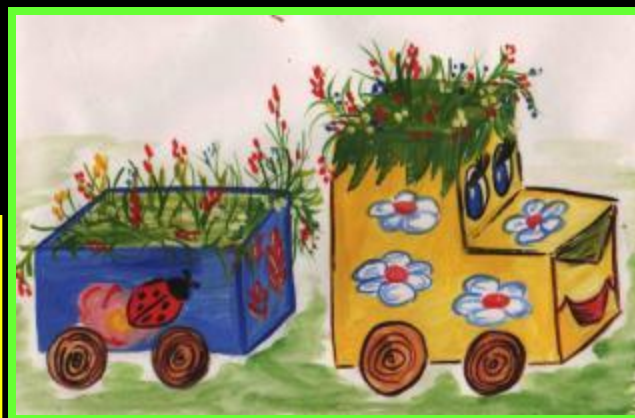
паровозик — клумбу