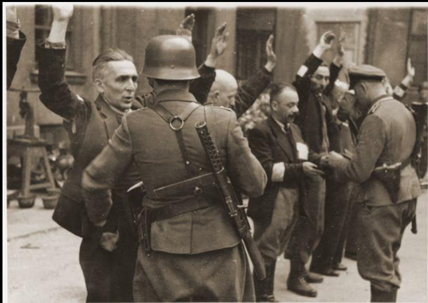
Варшавское гетто Рижское гетто