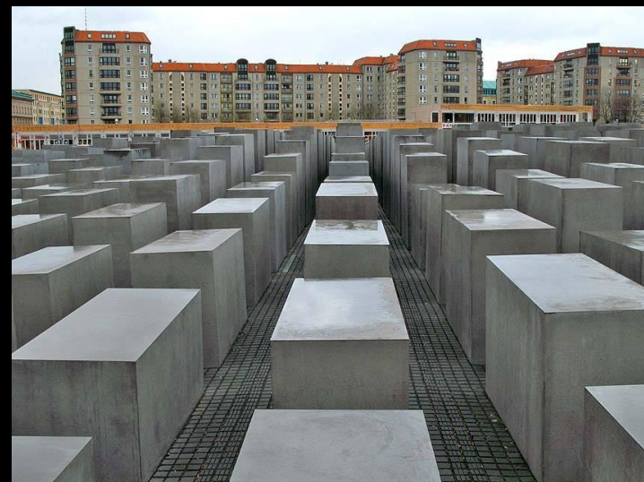
Мемориал жертвам Холокоста в Берлине