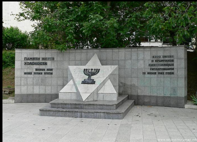
Памятник в Севастополе Мемориал в Майами