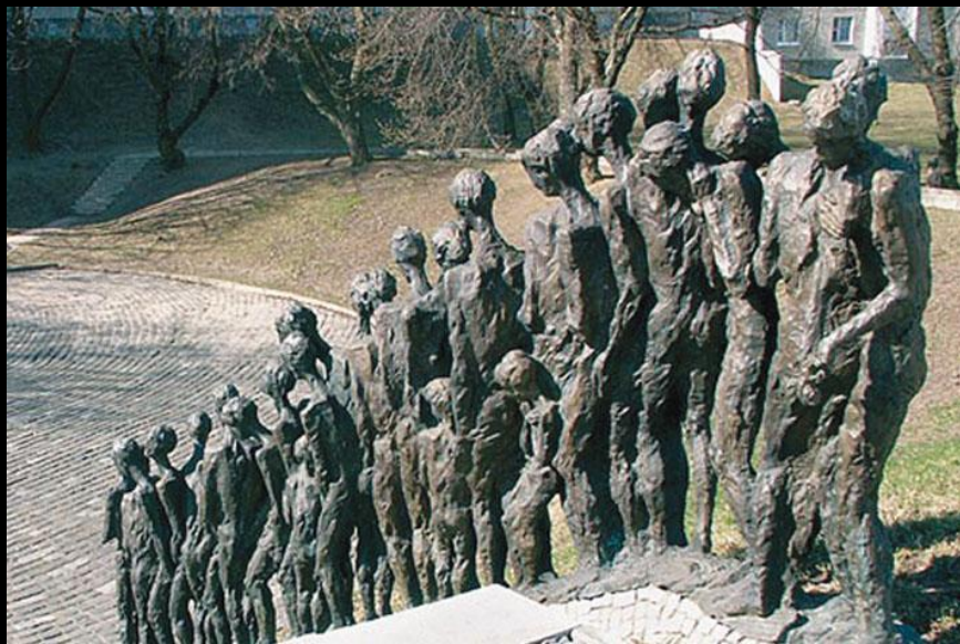
Памятник в Минске Памятник в Пушкине