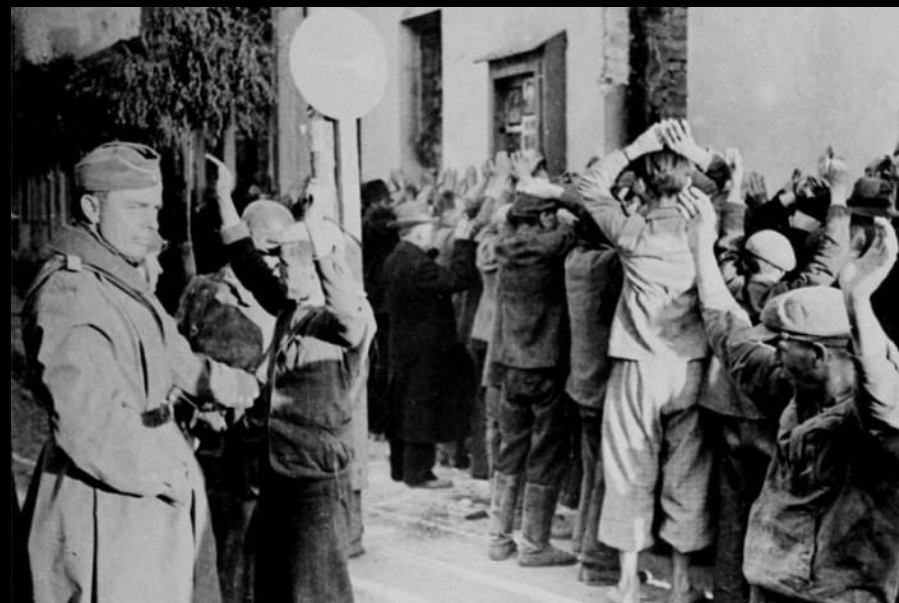
Варшавское гетто Минское гетто