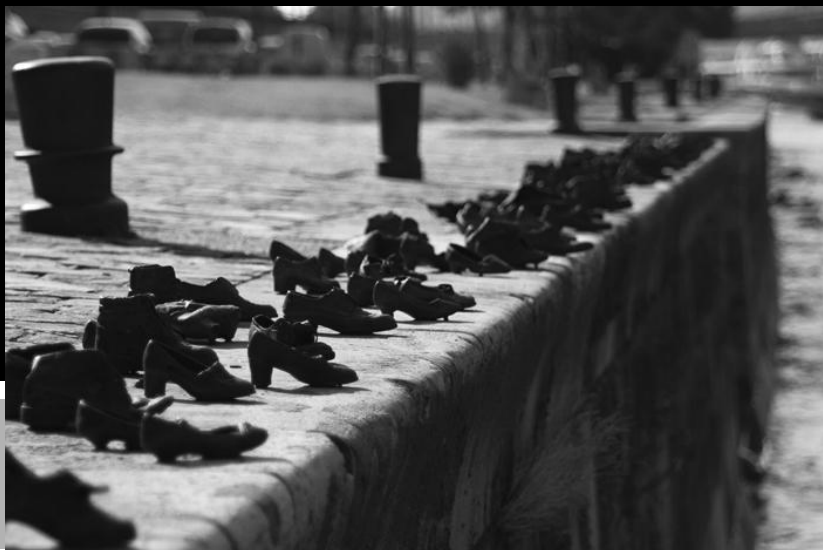
Памятник на набережной Дуная