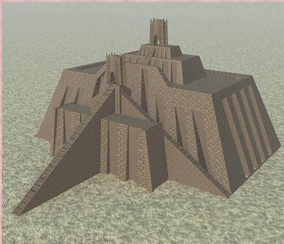
Зиккурат в древности