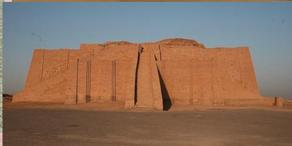
Вид зиккурата в настоящее время