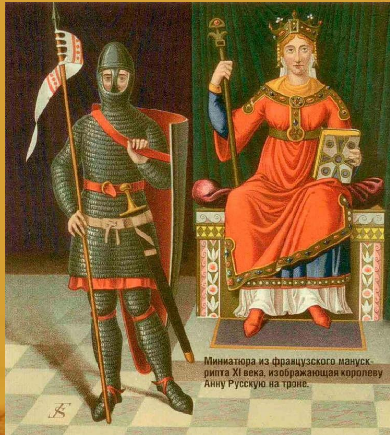
Миниатюра из французского манускрипта XI века, изображающая королеву Анну Русскую на троне.