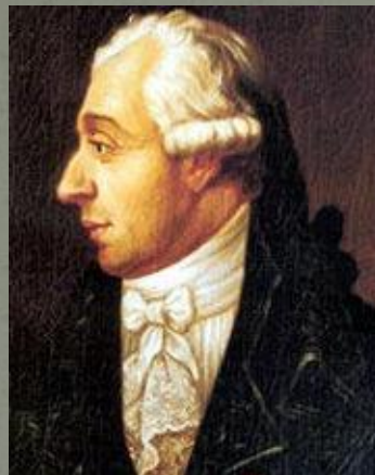
Академик П. Мешен