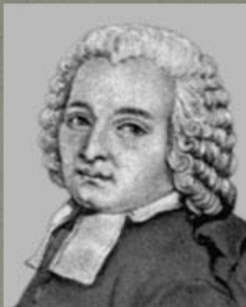
Академик Н. Лакайль