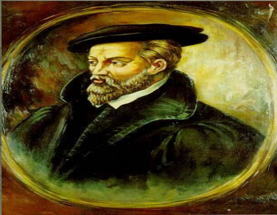
Георг Агрикола Пять книг о мерах и весах римлян и греков 1550

Возникновение метрологии как самостоятельной научной дисциплины