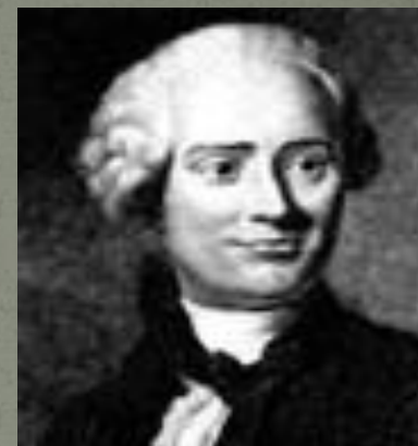
Академик Ж. Д'Аламбер