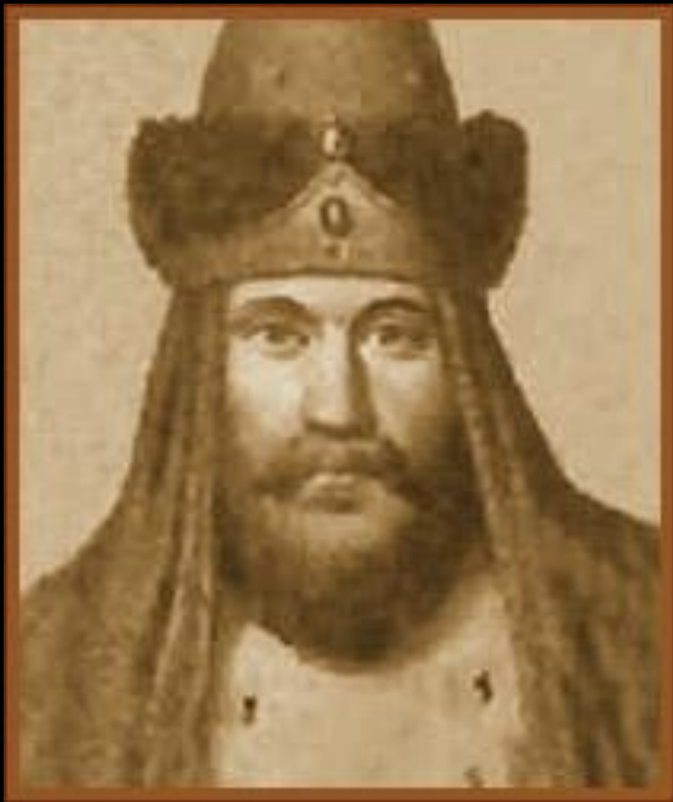
Василий I Дмитриевич Великий князь Московский в 1389 - 1425 годах

Он успешно воевал с Новгородом Великим, суздальскими, нижегородскими князьями, рязанским князем Олегом Ивановичем и Литвой. с 1395 года по 1412 год он не платил татарам дани. В 1392 году Василий Дмитриевич присоединил Муромское и Нижегородское княжества, в 1397-1398 годах - Бежецкий Верх, Муром, Вологду, Устюг, и земли коми. По приказу Василия Дмитриевича были “срублены” города Плес и