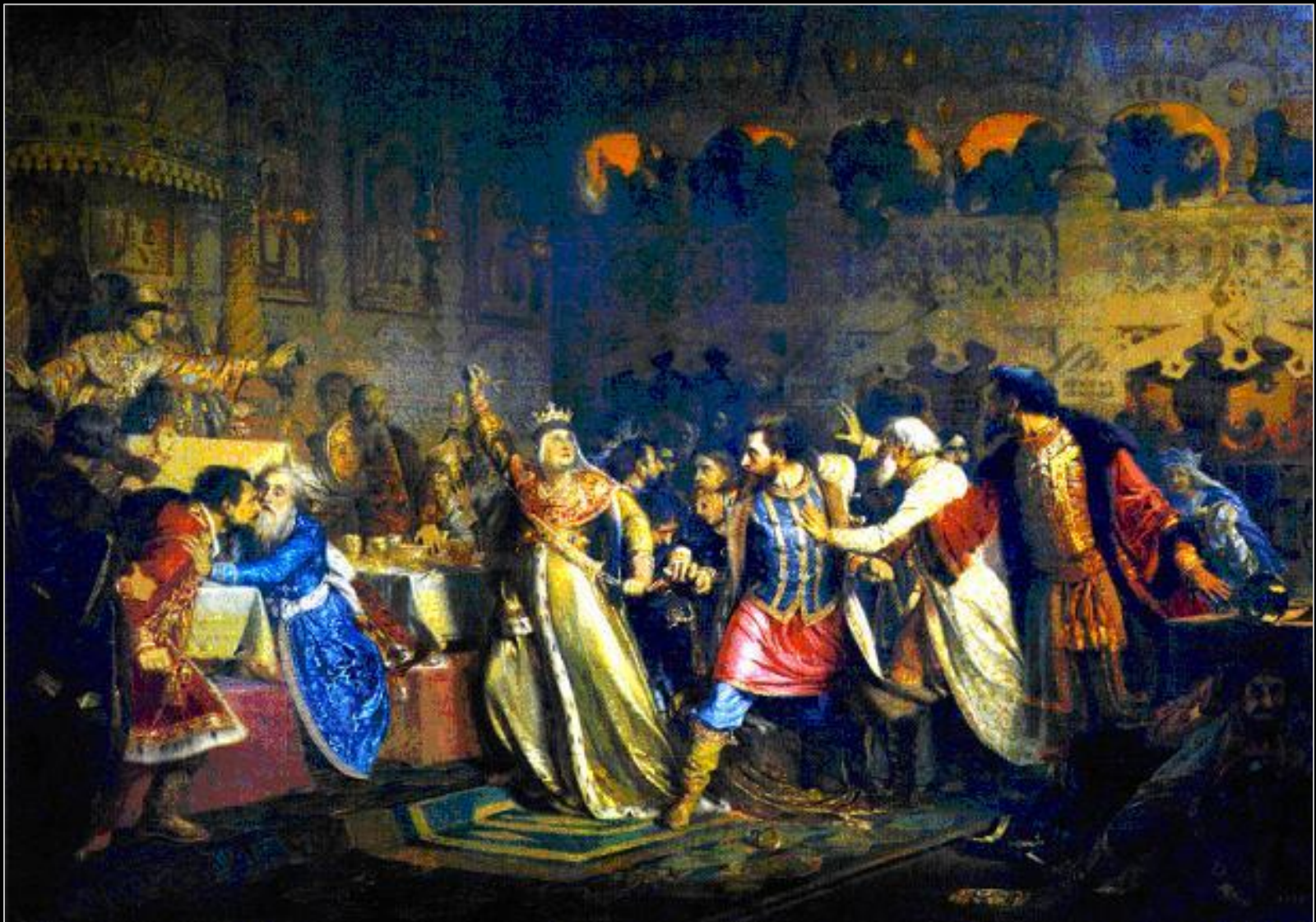
Великая княгиня Софья Витовтовна на свадьбе великого князя Василия Тёмного в 1433 году срывает пояс, принадлежащий