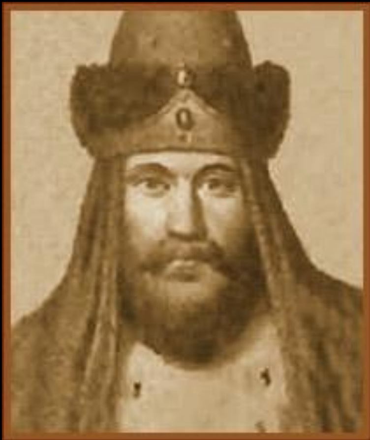
Василий I Дмитриевич Великий князь Московский в 1389 - 1425 годах

Он успешно воевал с Новгородом Великим, суздальскими, нижегородскими князьями, рязанским князем Олегом Ивановичем и Литвой.