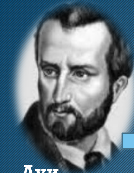
Луи Огюст Бланки

революционного заговора можно ликвидировать капитализм и достичь