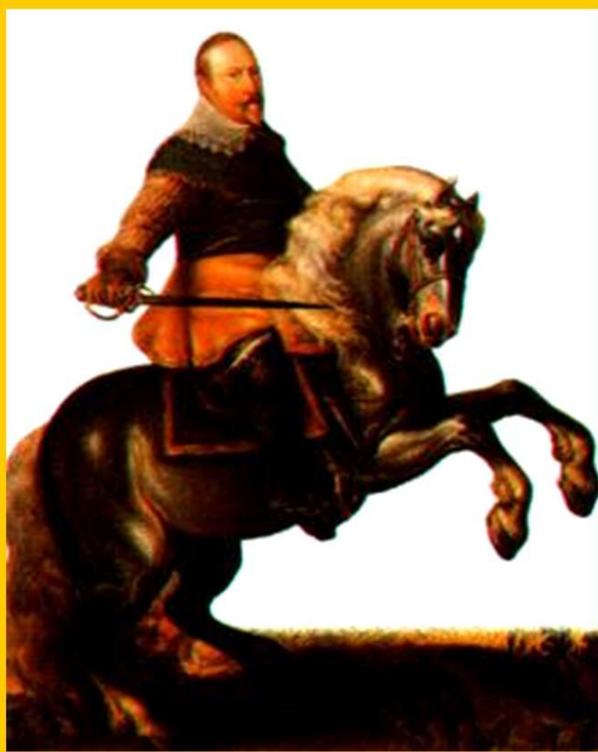
Густав Адольф II

Вскоре в Германию вторглись шведы и в 1632 г. Густав Адольф II разбил католиков, но сам погиб.