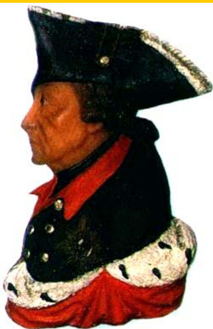
Фридрих II— Король Пруссии.

Международные отношения в 18 в. Были очень запутанными и противоречивыми. Пруссия, возглавляемая Фридрихом II Великим на чала захватнические войны. В ходе борьбы за австрийское наследство (1740-1748) Фридрих захватил Силезию и стремился подчинить Саксонию, Чехию, часть Польши. Он полагал что ослабшая Франция не станет мешать.