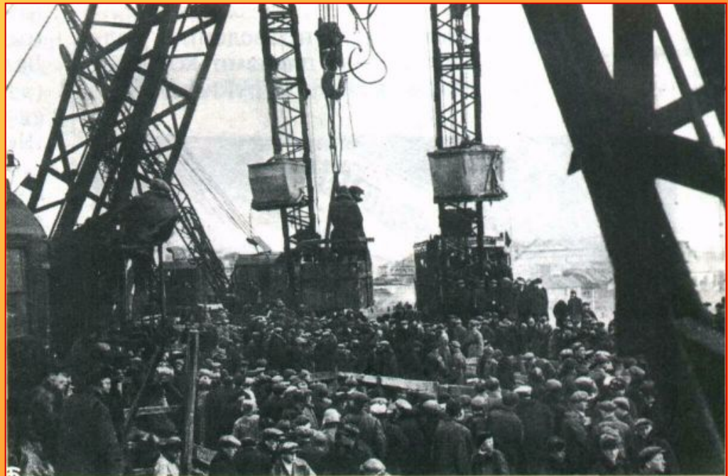
Строительство Днепрогэса. Фотография. 1932 г.

В годы первой и второй пятилеток (1929—1937) создаются угольно-металлургическая база на востоке (Магнитогорск — Кузнецк), нефтяная база в Башкирии, проводятся новые линии железных дорог (Турксиб, Новосибирск — Ленинск), появляются новые отрасли промышленности, которых не было в дореволюционной России, и т.д.