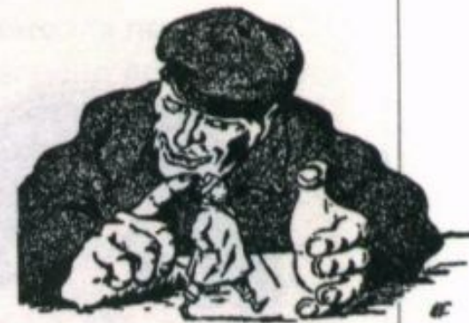
«До времени пусть погуляет». Карикатура на нэпмана из журнала «Крокодил». 1923 г.

Внедрялись в нэповскую экономику и элементы долгосрочного планирования . Первый такой план был подготовлен Государственной комиссией по электрификации России (ГОЭЛРО) и одобрен еще на VIII съезде Советов в декабре 1920 г. В феврале 1921 г. была учреждена Государственная плановая комиссия (Госплан).