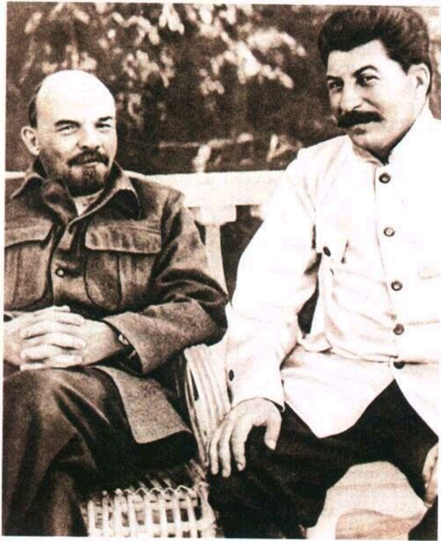
В. Ленин и И. Сталин фото, 1922 г.

Первый камень в фундамент культа личности И. В. Сталина закладывался в ходе внутривнутрипартийных дискуссий 20-х годов под лозунгом выбора верного, ленинского пути строительства социализма и установления идеологического единства.