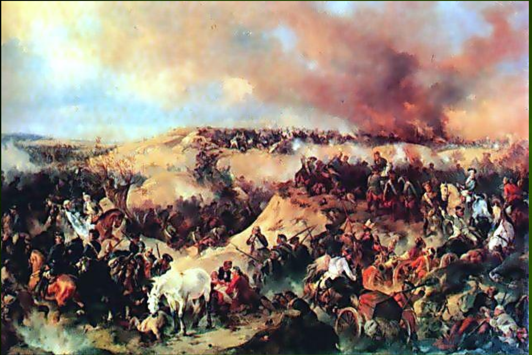
РУССКАЯ АРМИЯ В СЕМИЛЕТНЕЙ ВОЙНЕ (1756-1763).