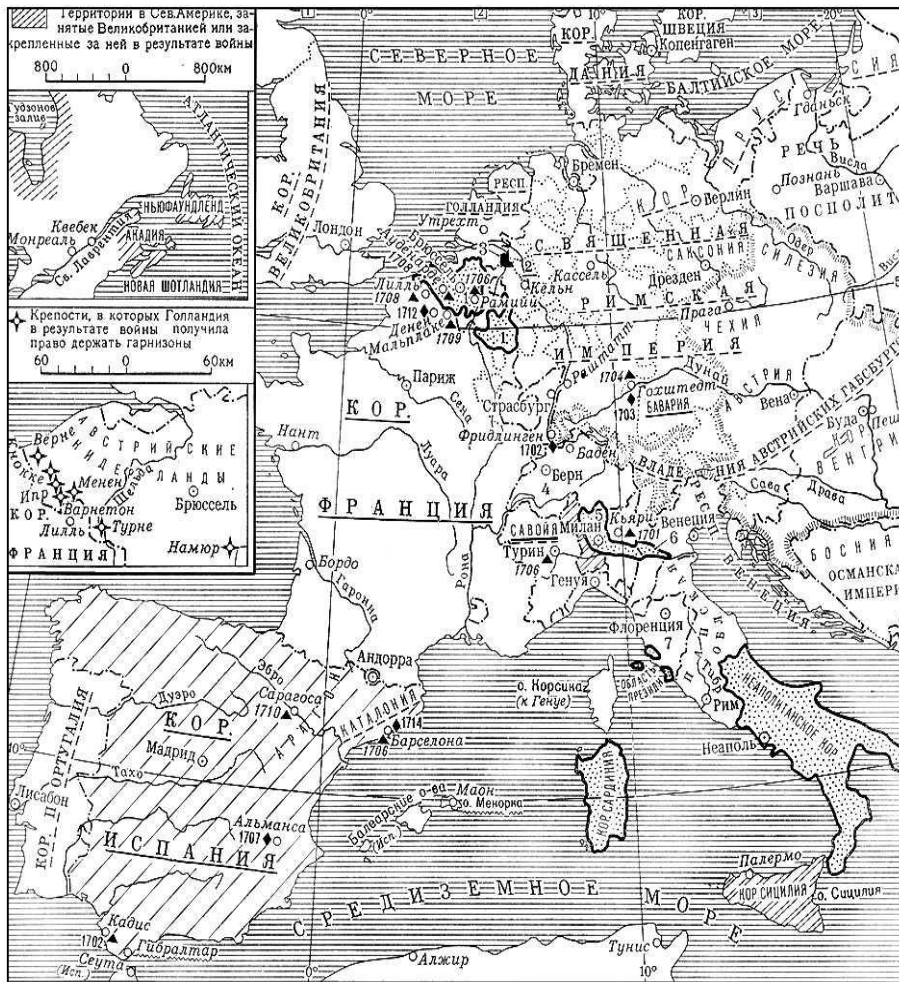
ВОЙНА ЗА ИСПАНСКОЕ НАСЛЕДСТВО 1701—1714 гг.