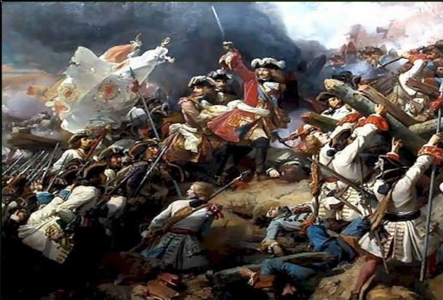
БИТВА ПРИ ДИНАНЕ. 1712