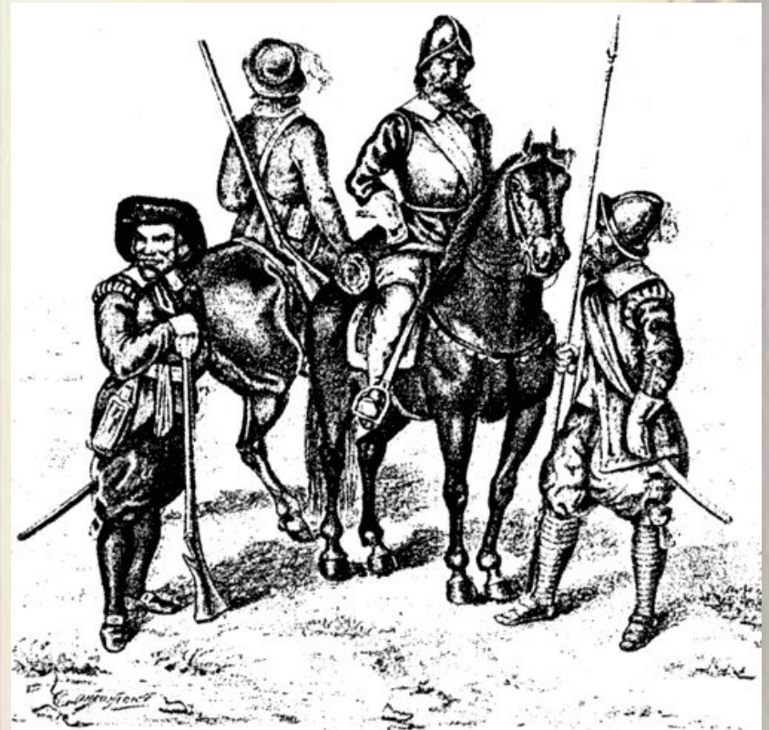
Шведские воины эпохи Густава-Адольфа (слева направо): мушкетер, драгун, кирасир, пикинер