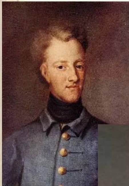
Карл XII, шведский король