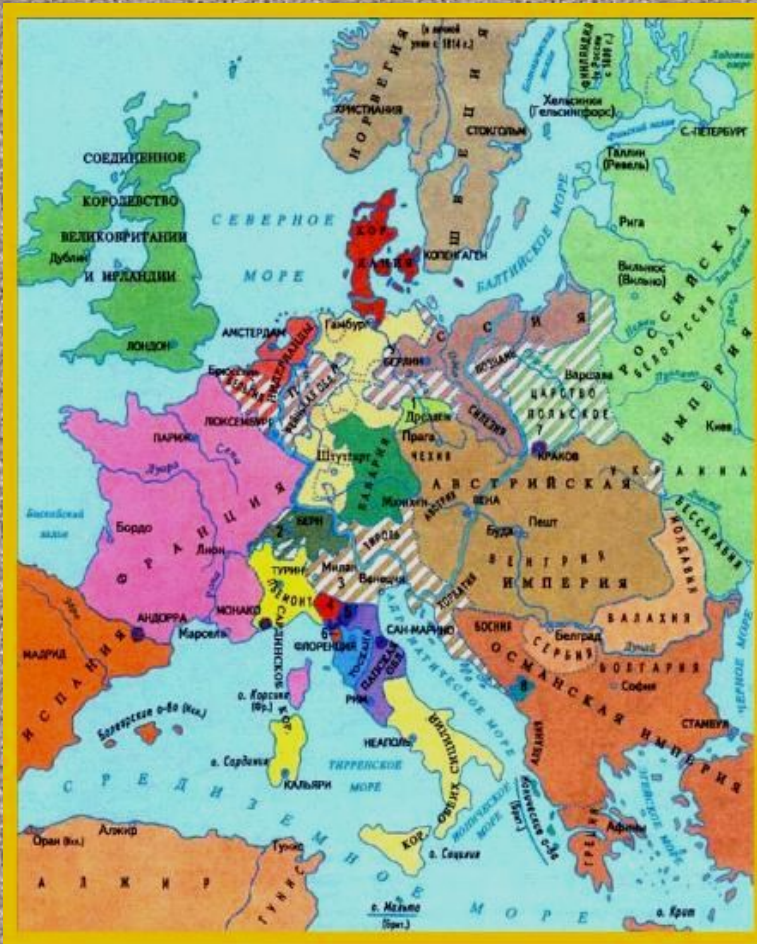
Европа после Венского конгресса