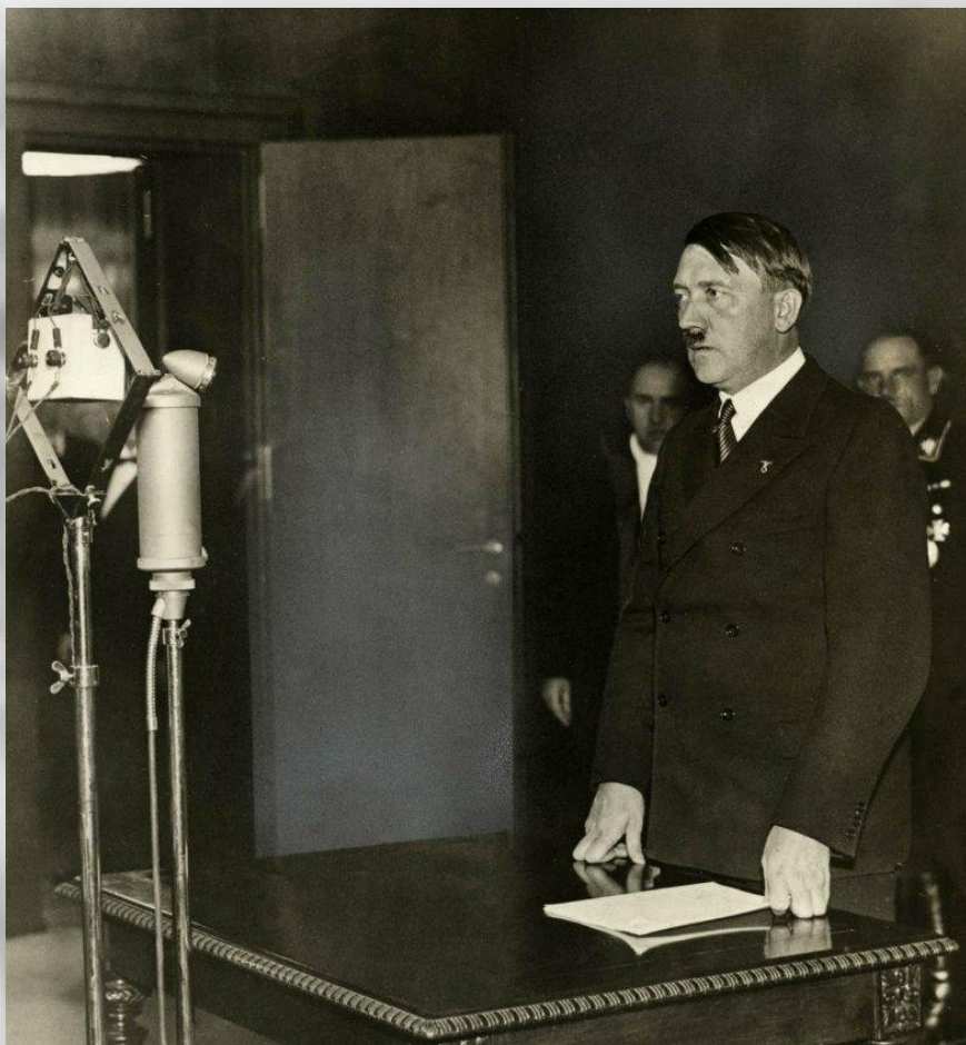
Гитлер заявляет о выходе Германии из Лиги Наций, октябрь 1933 г.