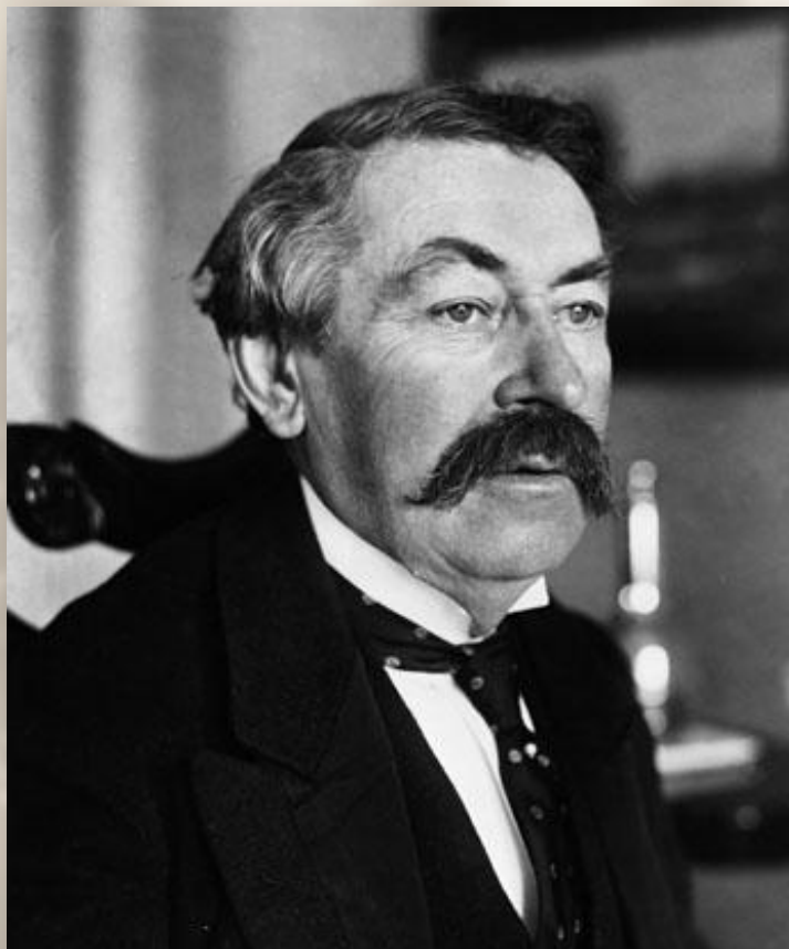
Аристид Бриан, министр иностранных дел Франции

Пакт Бриана-Келлога (август 1928 г.) — отказ от войны как средства национальной политики.