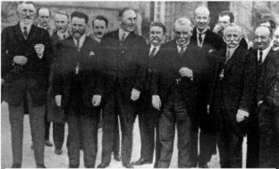
Представители стран Антанты