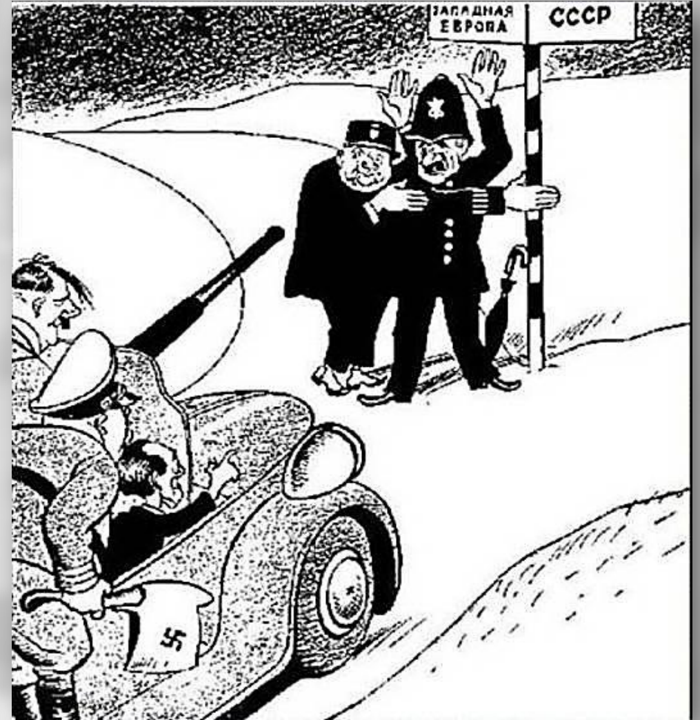
Мюнхенское соглашение, карикатура