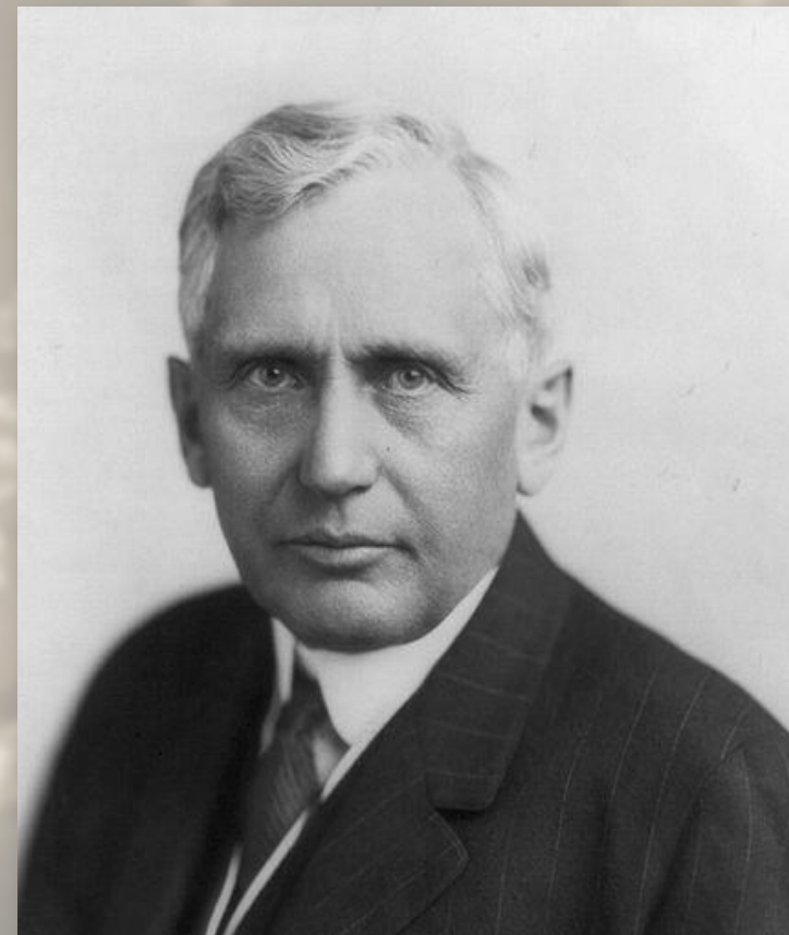
Фрэнк Келлог, государственный секретарь США

Пакт Бриана-Келлога (август 1928 г.) — отказ от войны как средства национальной политики.