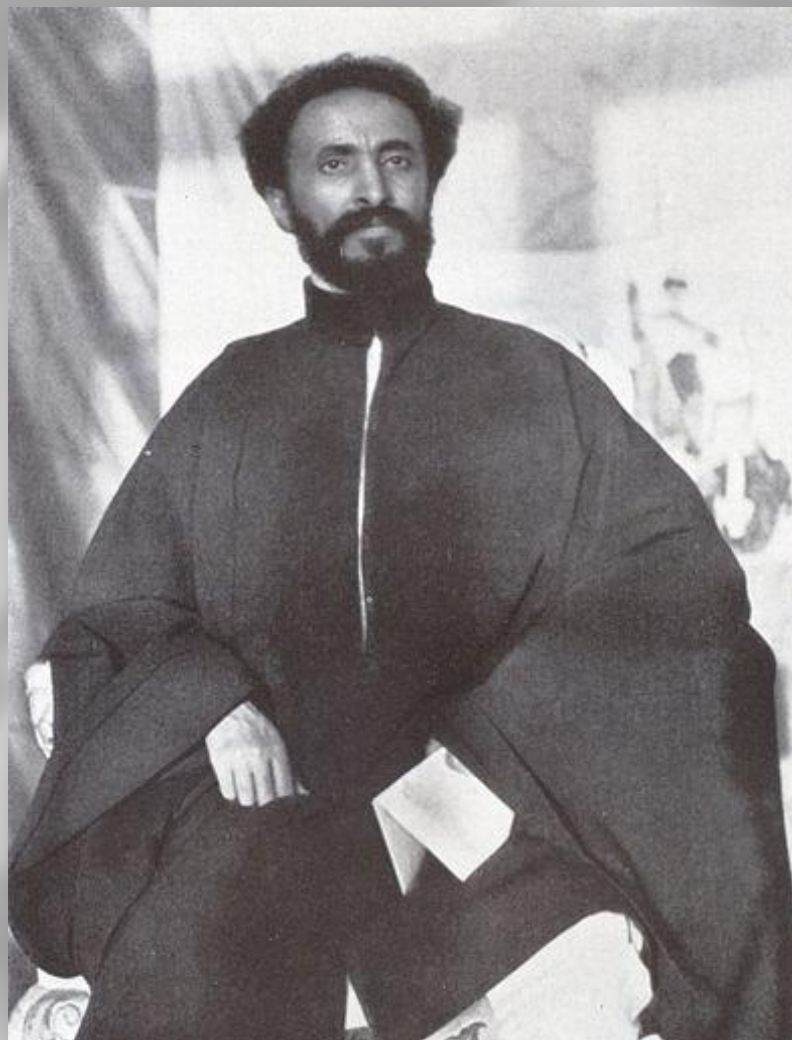
Хайле Селассие I, император Эфиопии