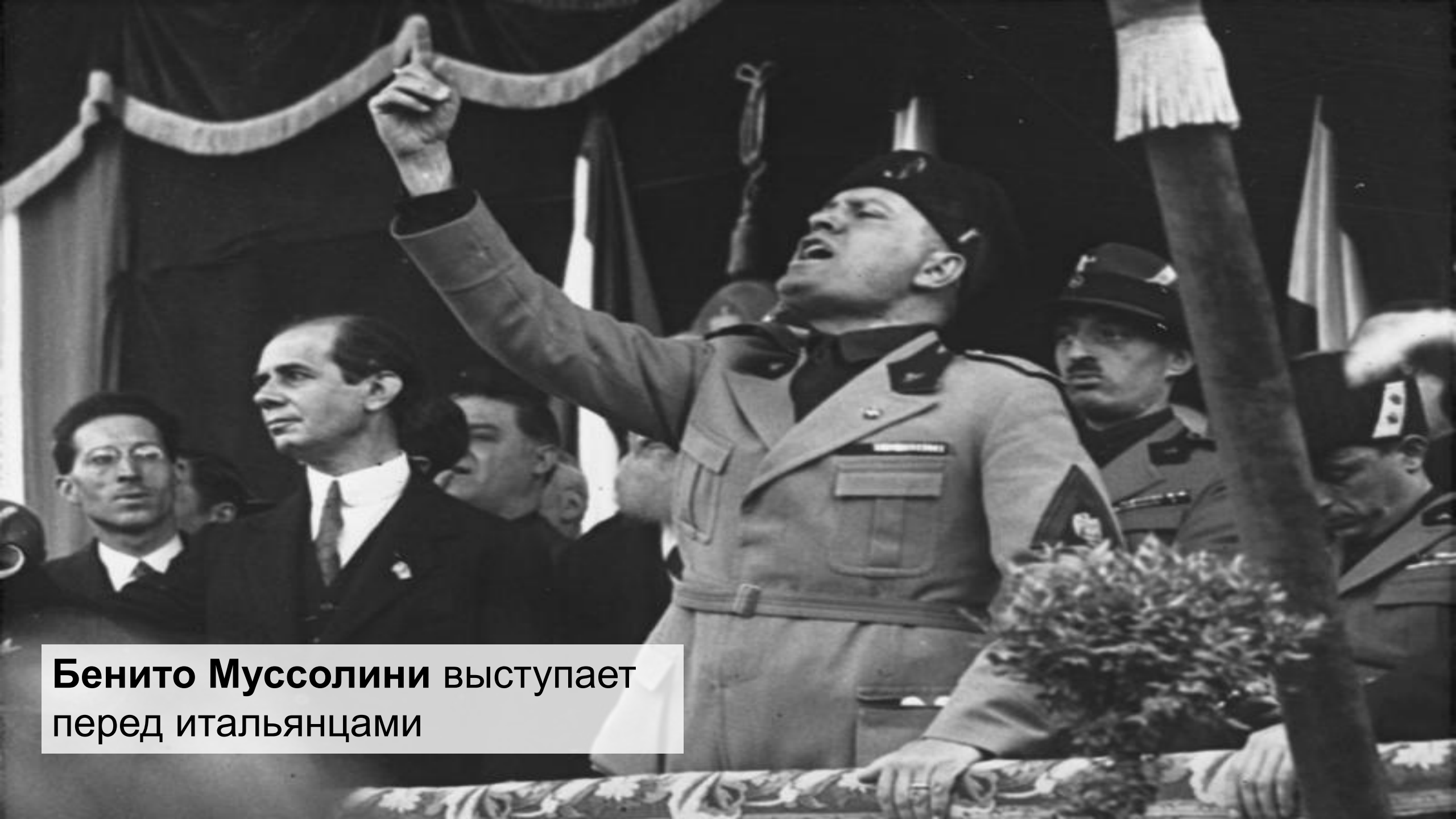
Бенито Муссолини выступает перед итальянцами