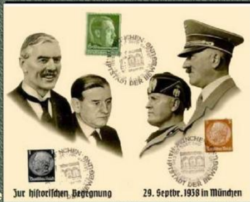
Немецкие памятные почтовые марки по случаю соглашения в Мюнхене.