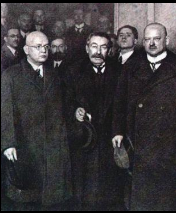
Аристид Бриан. (в центре).

Появилось огромное количество теорий о том как преодолеть кризис. Социалисты предлагали ликвидировать капитализм, националисты-установить господство над другими народами. В 1928 г. был подписан пакт Бриана-Келлога, запрещавший войну. Его гарантировали Лига наций и США. К сер.30-х пакт подписали 63 государства.