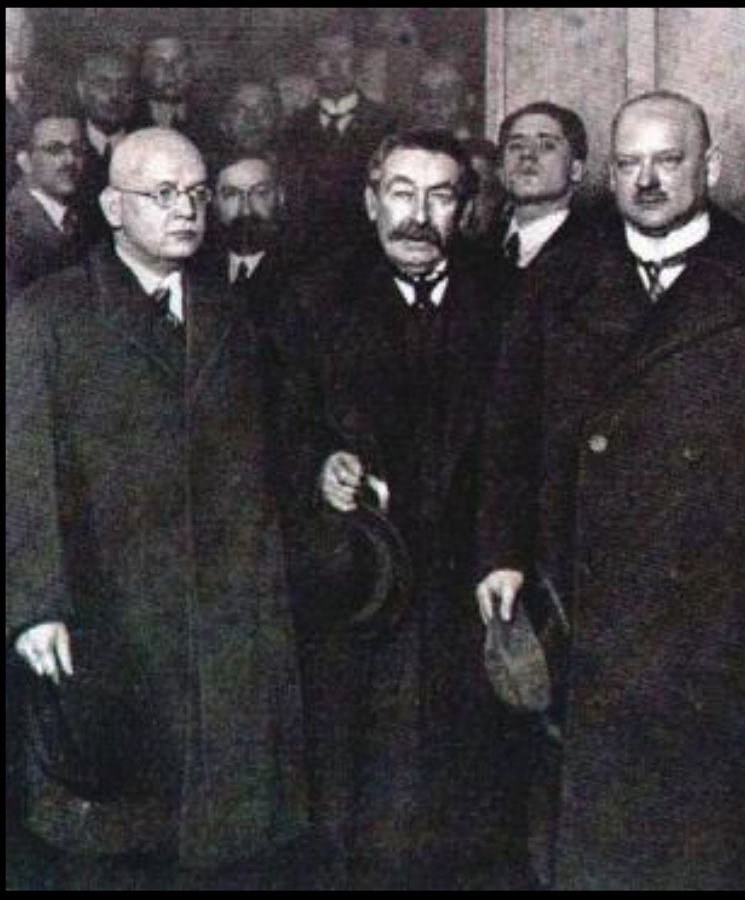
Аристид Бриан. (в центре).

Появилось огромное количество теорий о том как преодолеть кризис. Социалисты предлагали ликвидировать капитализм, националисты-установить господство над другими народами. В 1928 г. был подписан пакт Бриана-Келлога, запрещавший войну. Его гарантировали Лига наций и США. К сер.30-х пакт подписали 63 государства.