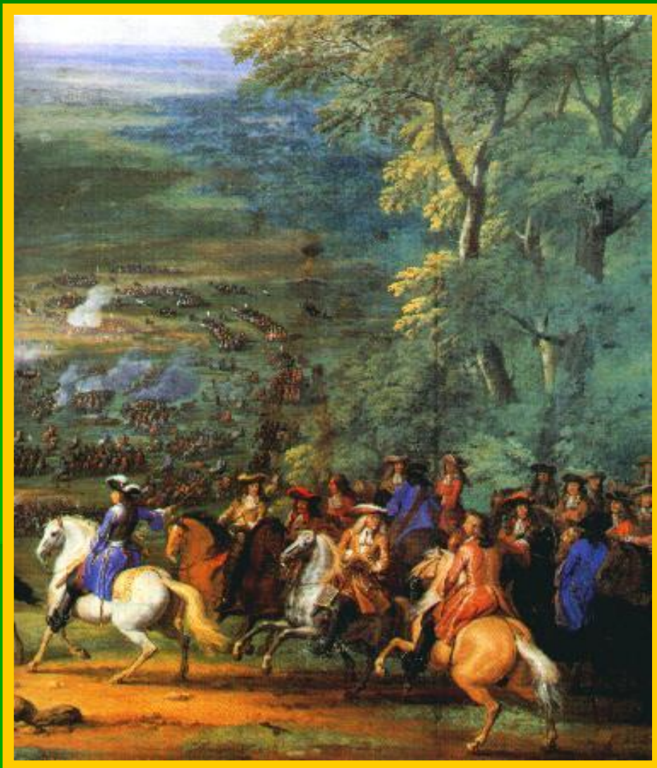
Принц Конде в битве при Рокруа.

Вскоре в Германию вторглись шведы и в 1632 г. Густав Адольф II разбил католиков, но сам погиб.