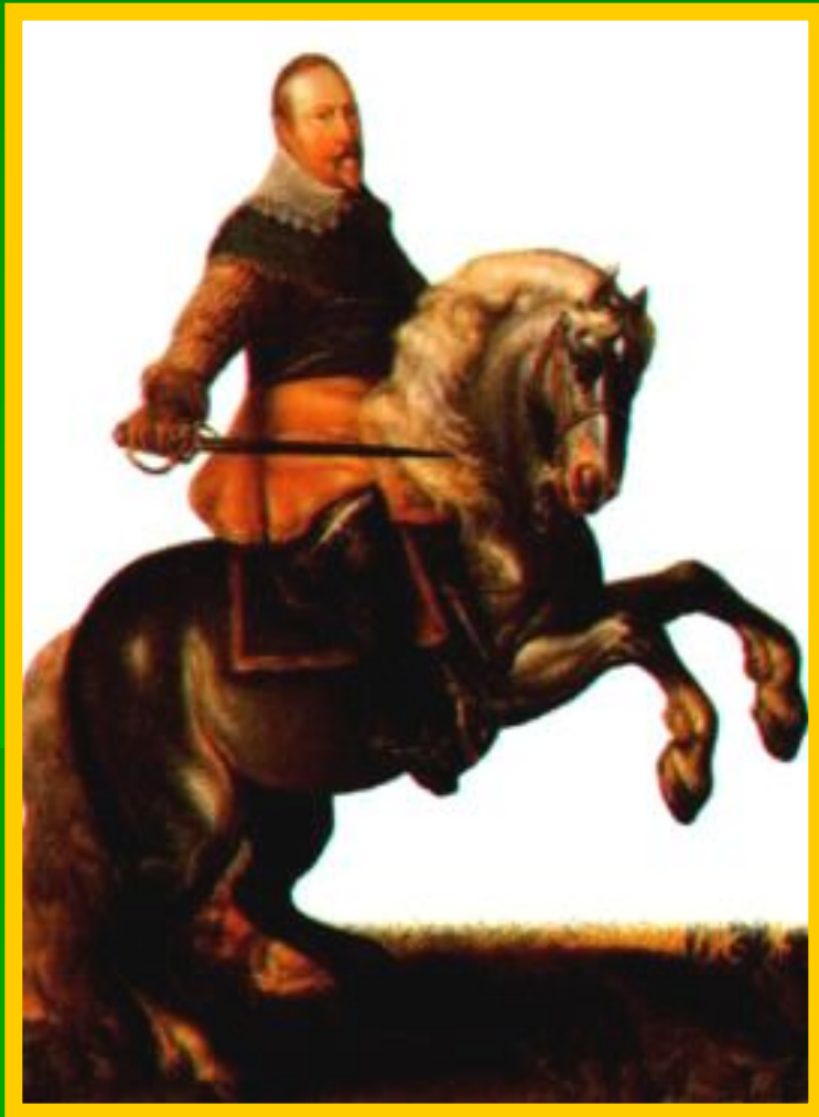
Шведский король Густав Адольф II.