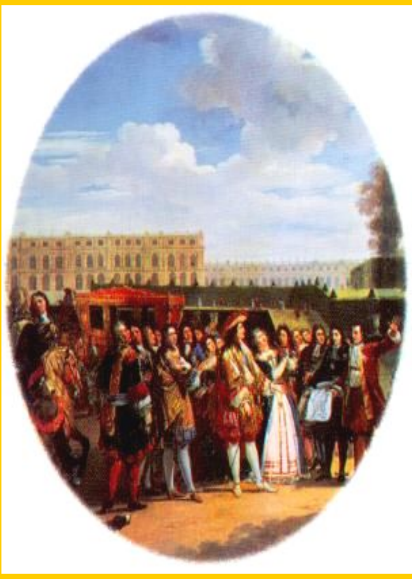
Людовик XIV осматривает Версаль

По окончании войны самыми могущественными государствами стали Швеция и Франция. Французскому королю подражали все европейские монархи. Версаль стал образцом дворцово-паркового зодчества. Франция постоянно участвовала в войнах, но они истощили ее. В войне за испанское наследство австрийцы дошли до Версаля и Людовика XIV спасло лишь чудо.