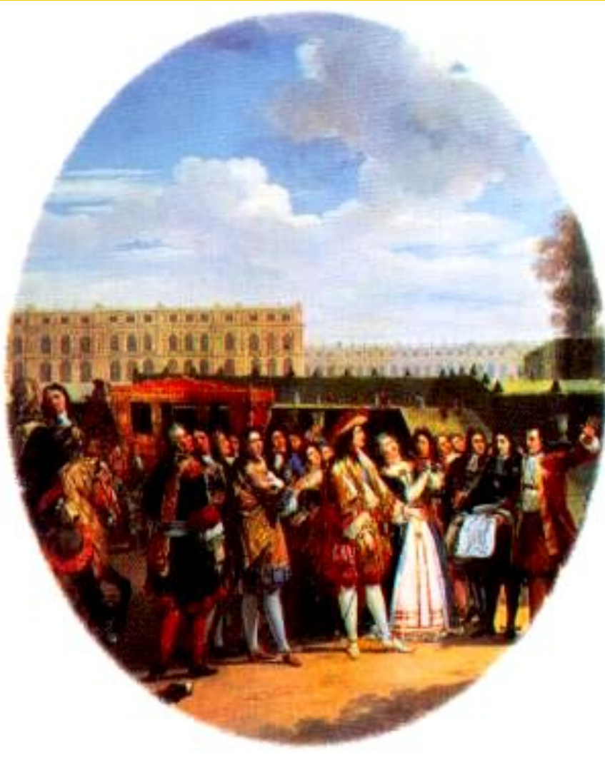
Людовик XIV осматривает Версаль

По окончании войны самыми могущественными государствами стали Швеция и Франция. Французскому королю подражали все европейские монархи. Версаль стал образцом дворцово-паркового зодчества.