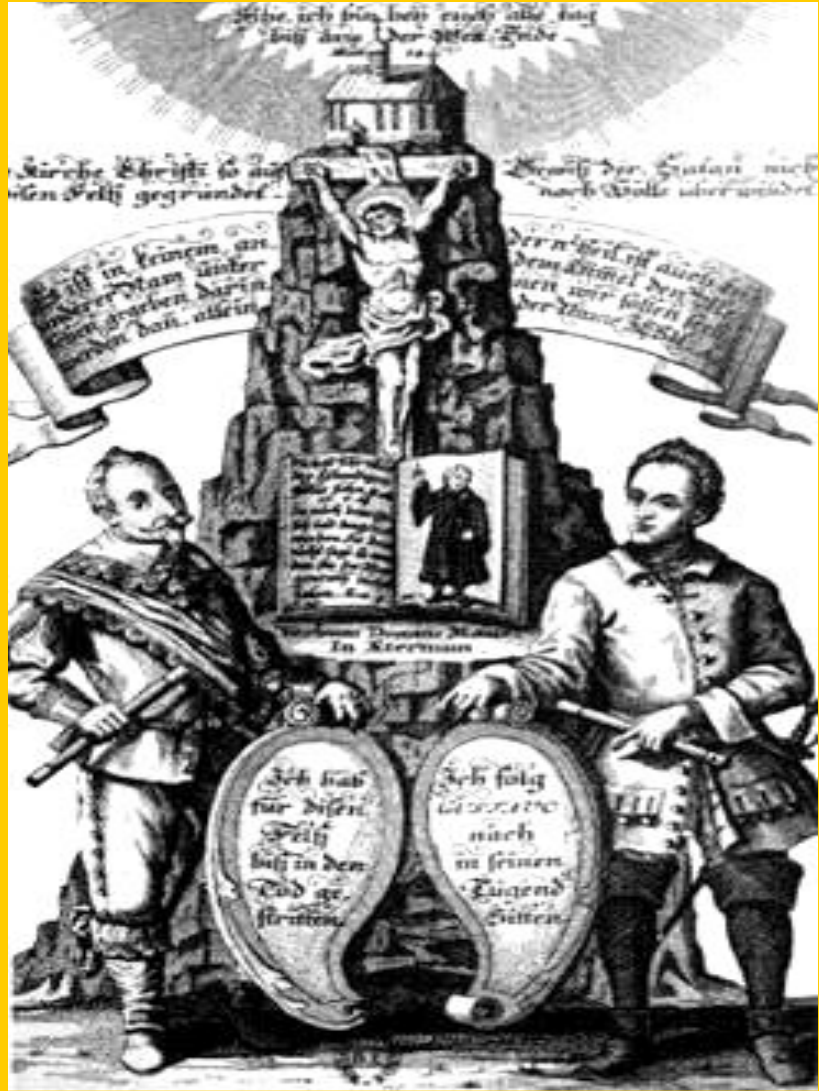
Густав Адольф II и Карл XII. Мощь Швеции.

Поражение в войне означало окончание французской гегемонии в Европе.