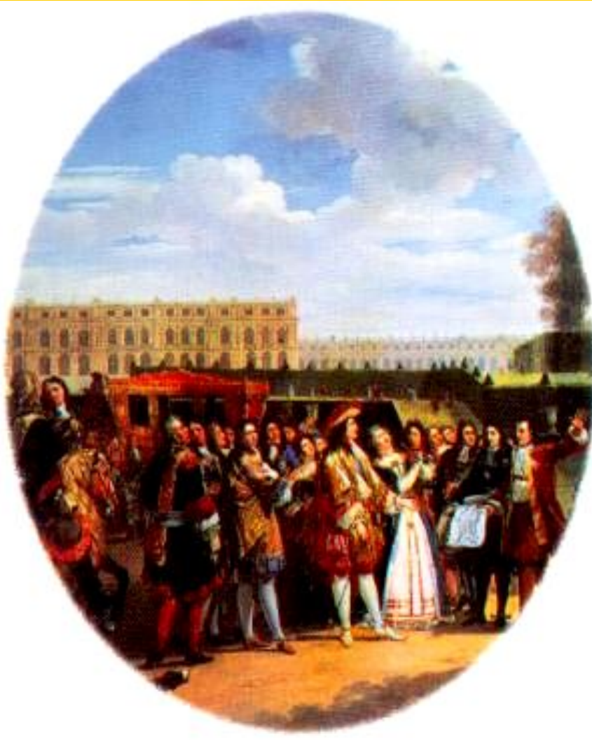
Людовик XIV осматривает Версаль

По окончании войны самыми могущественными государствами стали Швеция и Франция. Французскому королю подражали все европейские монархи. Версаль стал образцом дворцово-паркового зодчества.