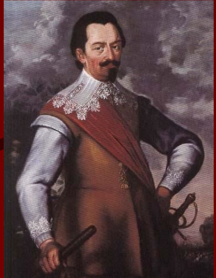
Альбрехт Валленштейн – имперский главнокомандующий