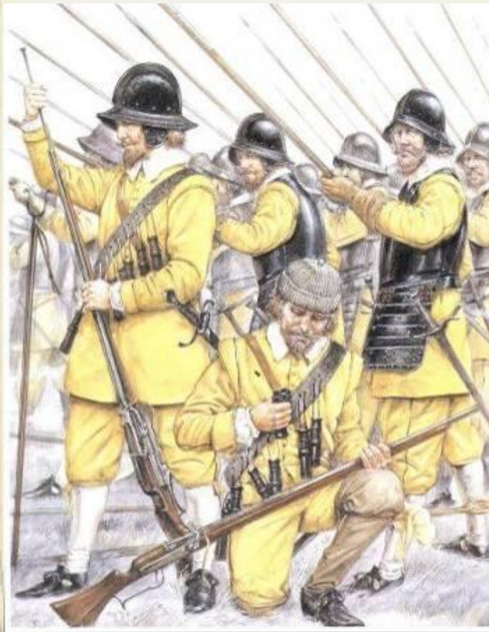
Солдаты «Желтой» бригады одного из основных подразделений шведов в битве при Лютцене 1632 год.