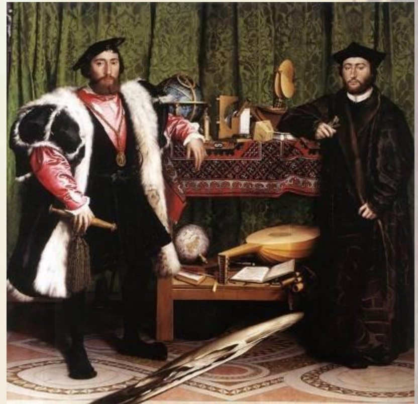
Ганс Гольбейн Младший Послы, 1533