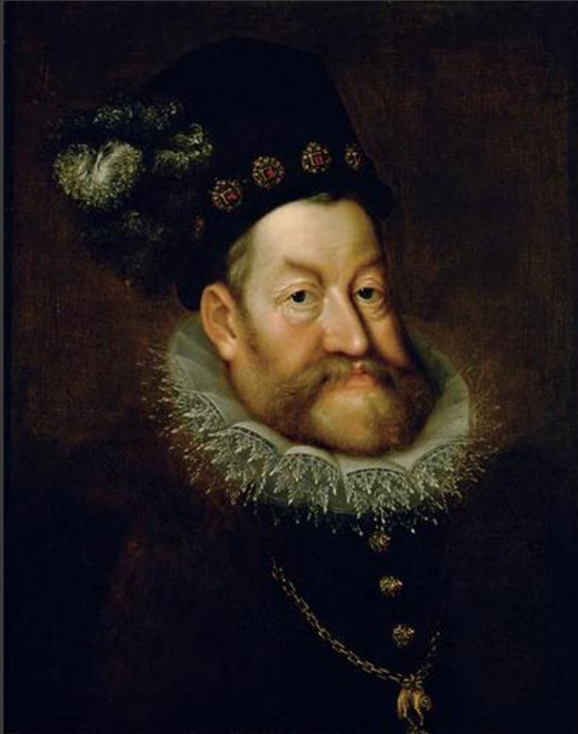
Римский император Карл VI

Карл VI родился 1 октября 1685 в Вене - император Священной Римской империи с 1711 года, последний потомок Габсбургов по прямой мужской линии. Король Чехии с 17 апреля 1711 года (коронован 5 сентября 1723 года, вступил на престол под именем Карл II ), король Венгрии с 17 апреля 1711 года (вступил на престол под именем Карл III ) и претендент на испанский престол (как Карл III ).