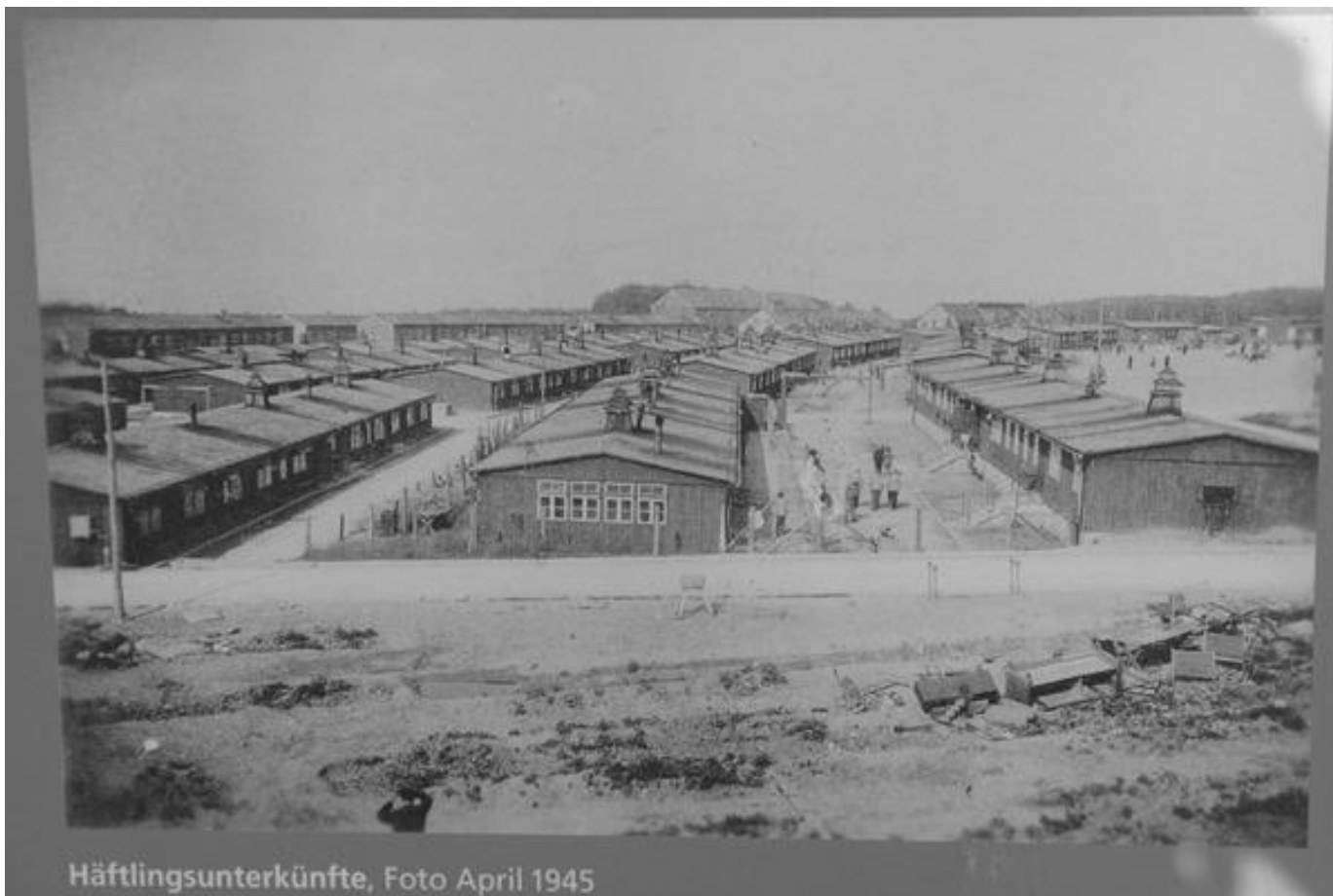
Häftlingsunterkünfte, Foto April 1945