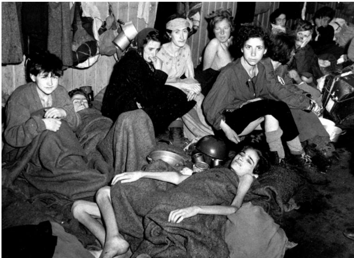
Освобожденные узники Бухенвальда