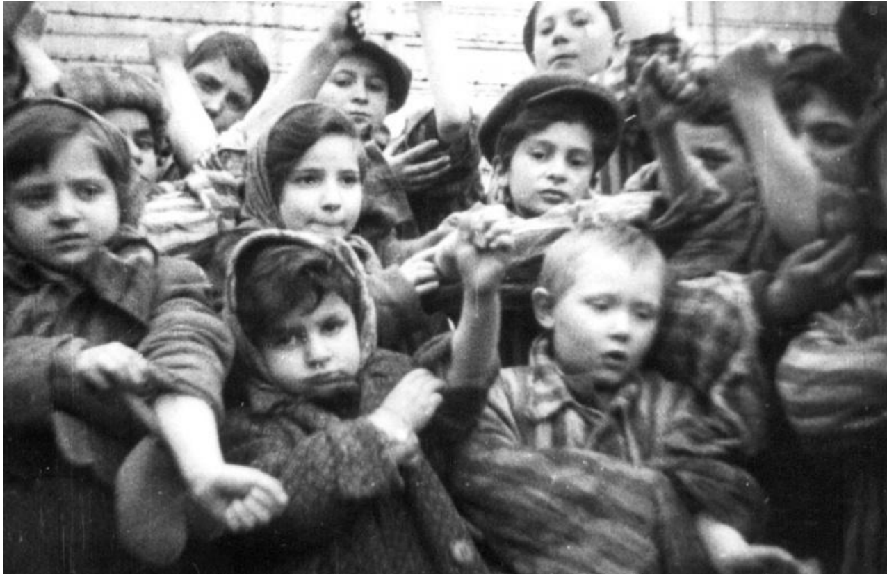
Дети показывают лагерные номера