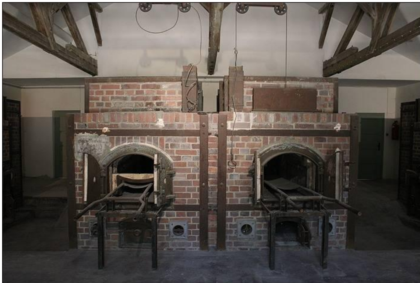
Печи крематория в Бухенвальде