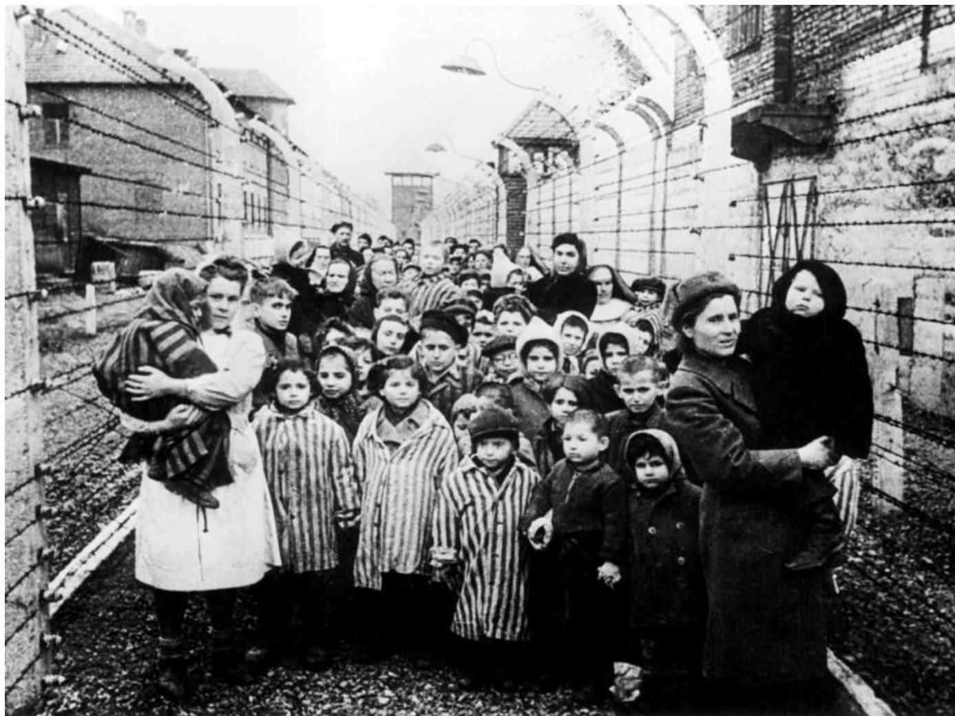
Лагерь в Освенциме (Польша)