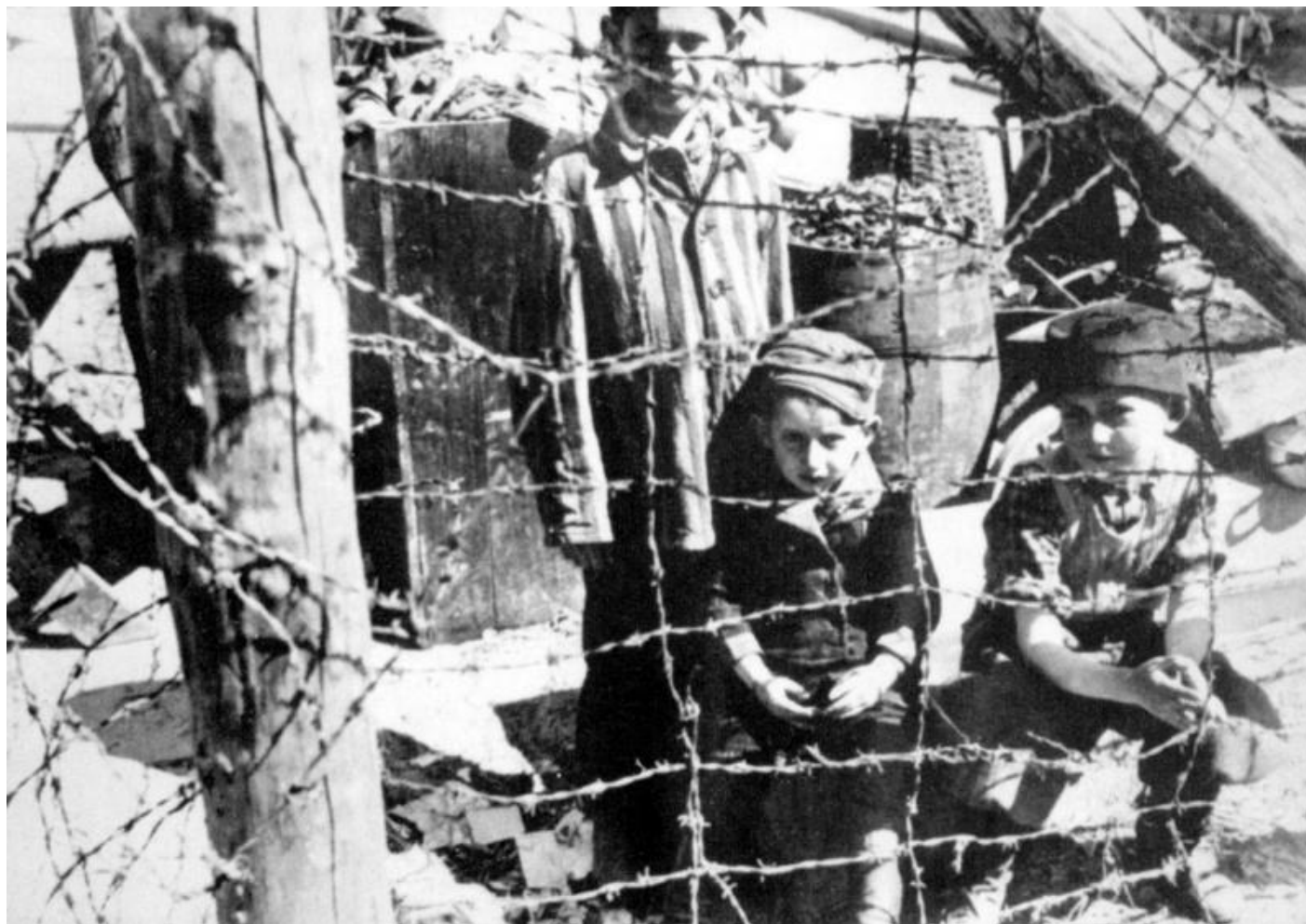
Дети – узники фашистских концентрационных лагерей