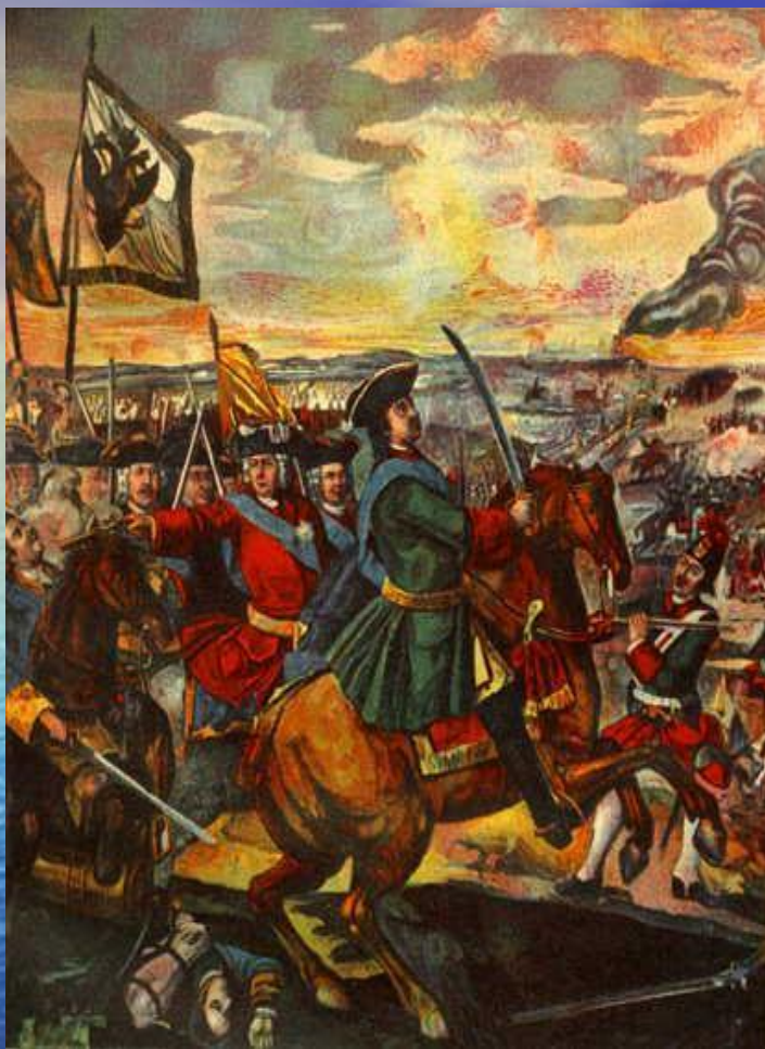
М.В. Ломоносов. Полтавская баталия. Фрагмент