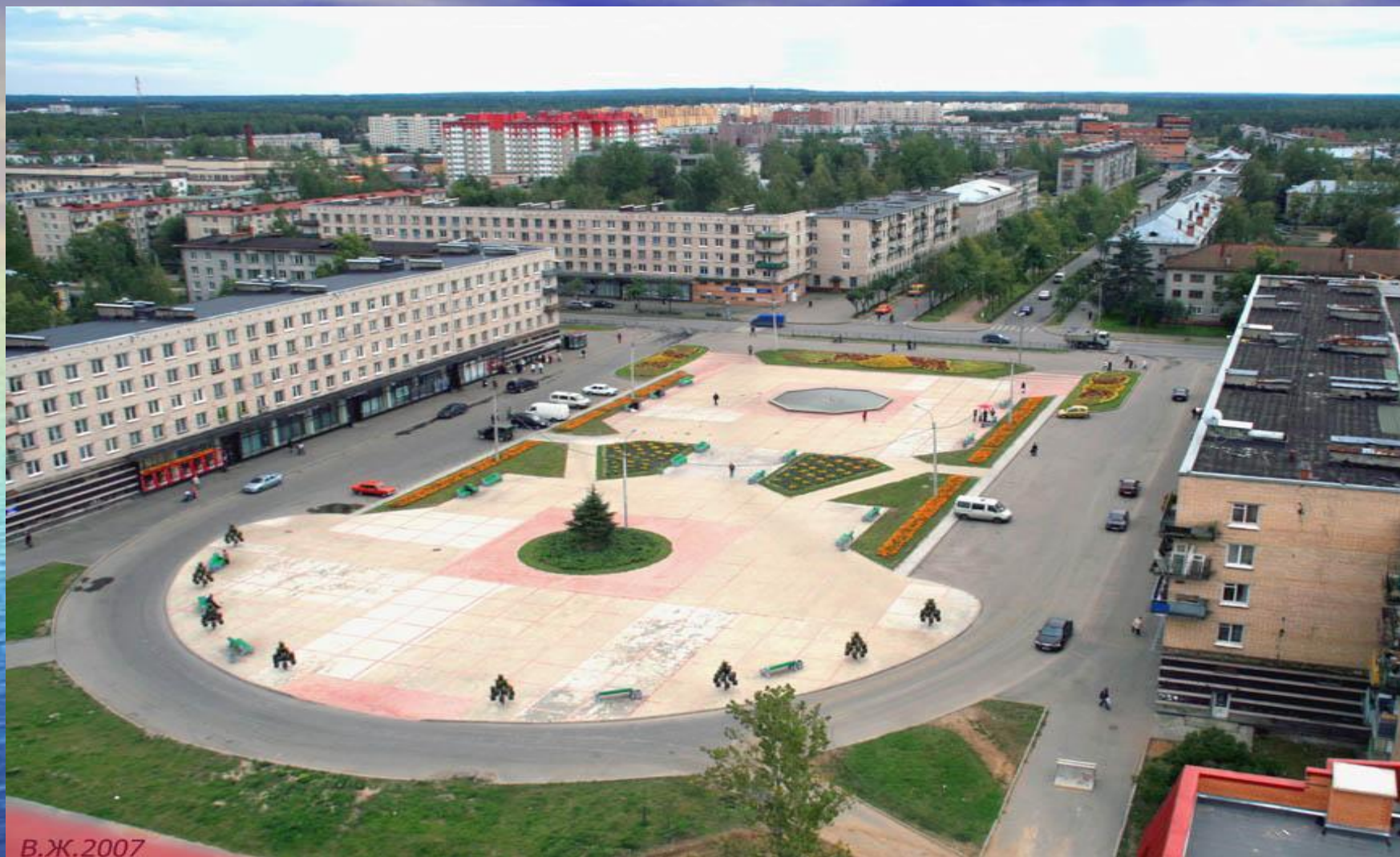
Город Ломоносов в составе Петродворцового района Санкт-Петербурга