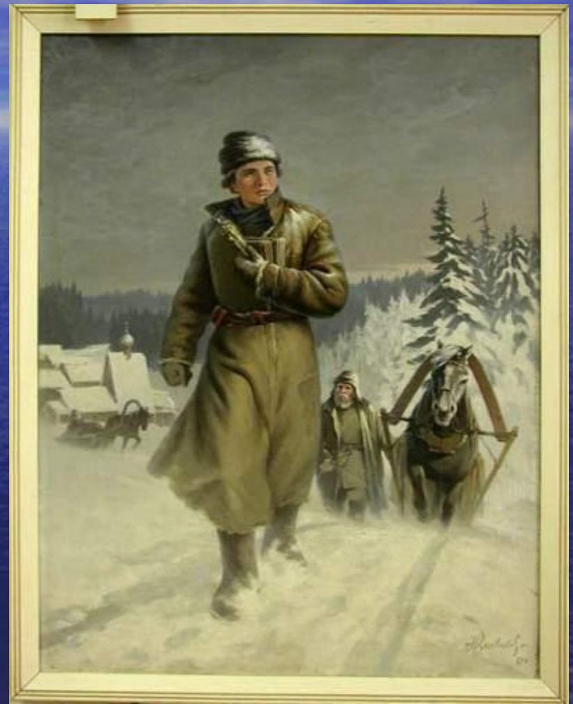
Н.И.Кисляков. Юный Ломоносов на пути в Москву