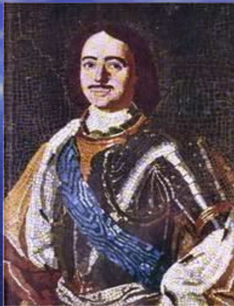
Петр Первый. Мозаика работы М.В. Ломоносова