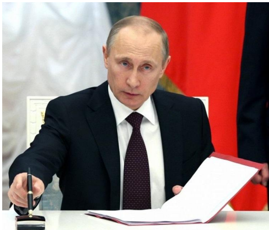
Президент Российской Федерации Владимир Владимирович Путин

В целях сохранения военно-исторического и культурного наследия, укрепления единства русского народа и в связи с исполняющимся в 2021 году 800-летием со дня рождения государственного деятеля и полководца князя Александра Невского п. 3. Рекомендовать органам государственной власти субъектов Российской Федерации и органам местного самоуправления принять участие в подготовке и проведении празднования 800-летия со дня рождения князя Александра Невского п о с т а н о в л я ю: