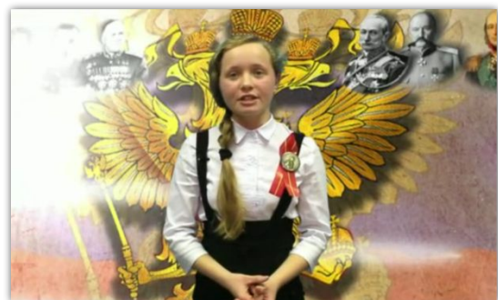
Лучшие видео работы:

https://vk.com/videos-121019921?section=album_3