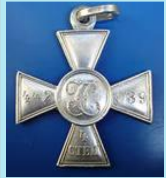
был удостоен ордена святого Георгия 4-й степени