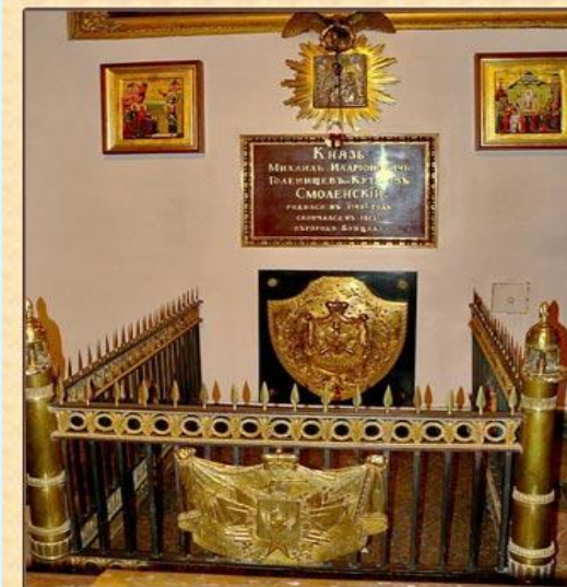
Надгробие М. И. Кутузова в Казанском соборе

Тело Кутузова было перевезено в Петербург, где погребено в Казанском соборе при всеобщей печали народа.