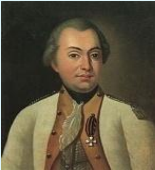
Портрет М. И. Кутузова в мундире полковника Луганского пикинерного полка