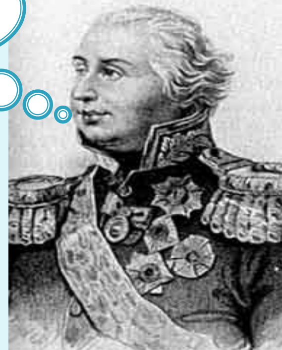
Совет в Филях сентябрь 1812 г.