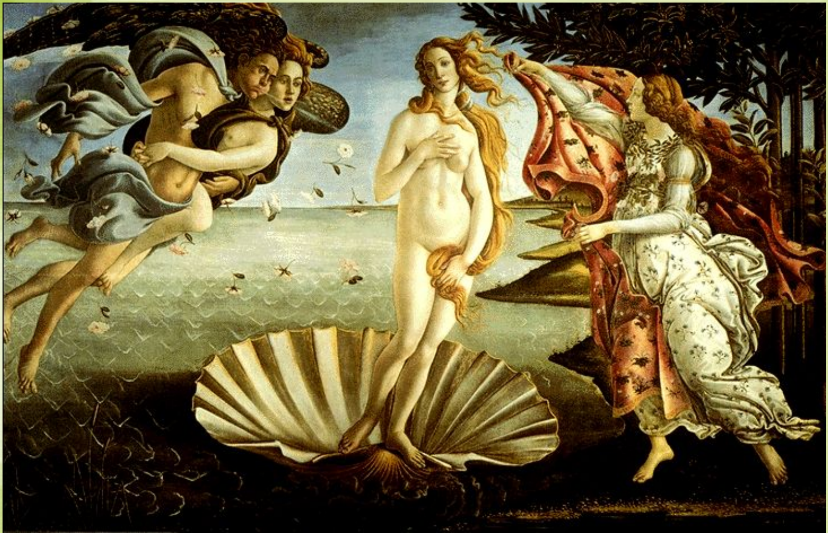
Боттичелли «Рождение Венеры»