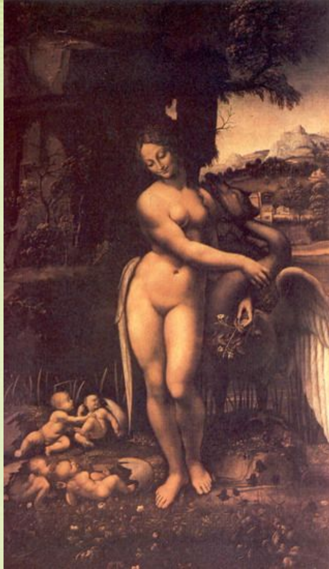
Леонардо да Винчи «Леда»