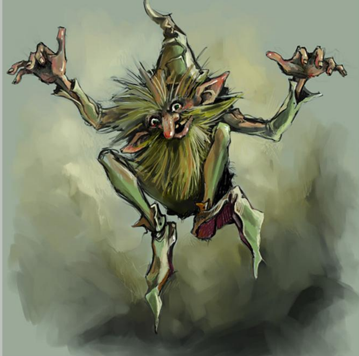
Маленький сгорбленный старичок