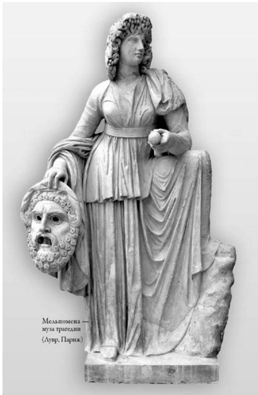
Мельпомена — муза трагедии (Лувр, Париж)

Мельпомена М е I р о т е н h – Муза трагедии. В руках у нее трагическая маска. Сначала Мельпомена считалась музой песни, затем печальной песни, а впоследствии она становится покровительницей театра вообще, олицетворением трагического сценического искусства. Мельпомена изображалась в виде женщины с повязкой на голове и в венке из листьев винограда или плюща, в театральной мантии, с трагической маской в одной руке и мечом или палицей в другой (символ неотвратимости наказания человека, нарушающего волю богов). От бога реки Ахелоя родила чудовищных сирен, прославившихся своим пением.